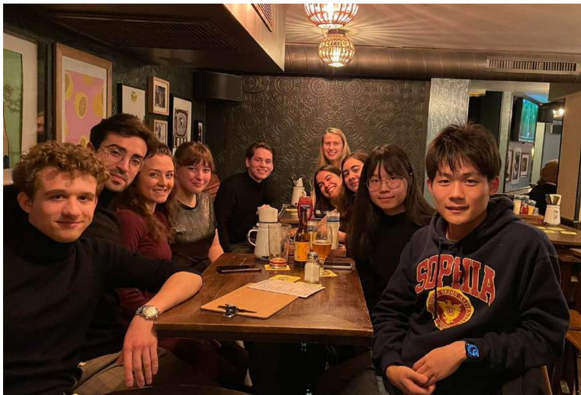
期末後教授舉辦的after party (soirée)