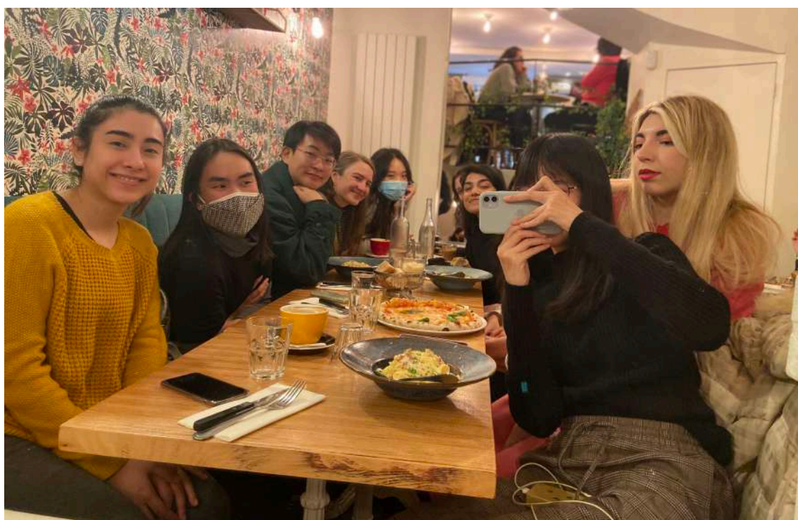
和迎新的組員一起吃午餐