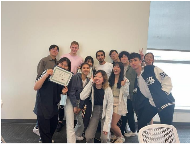
與其他交換生合照