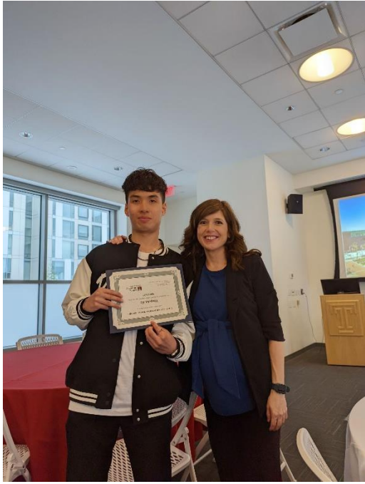
Global Program 專員