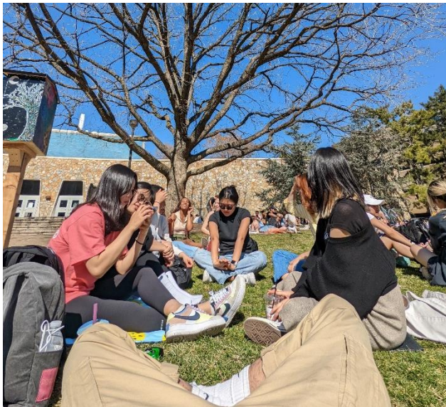
校內草地很多人野餐曬太陽