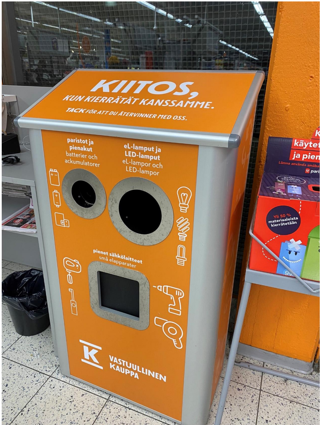
超市電器回收 瓶罐記得留著拿回來退瓶換錢 很多錢