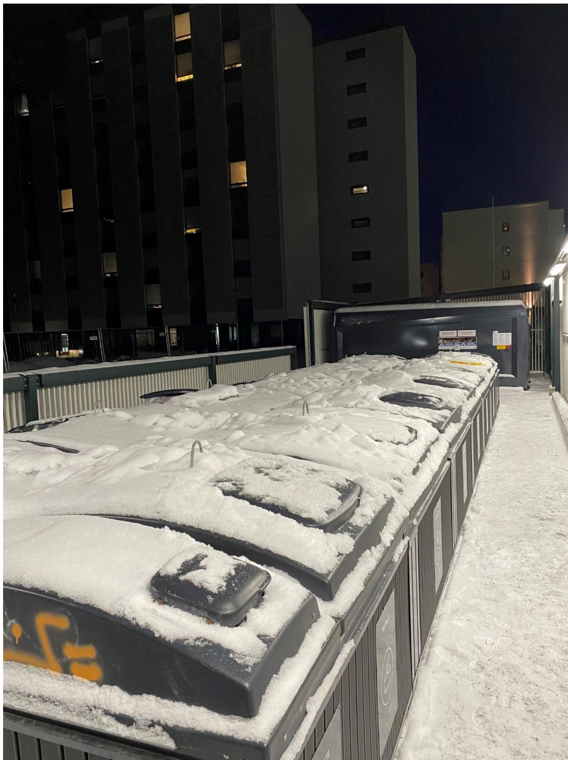
宿舍附近都會有資源回收廠很方便