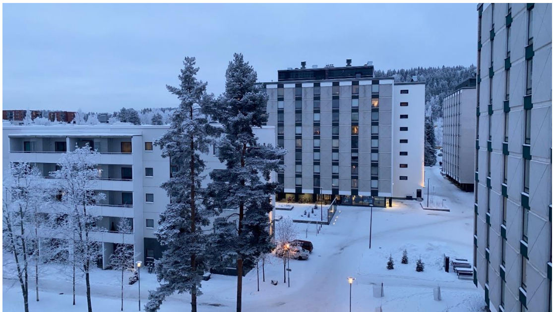
我的宿舍看出去的風景