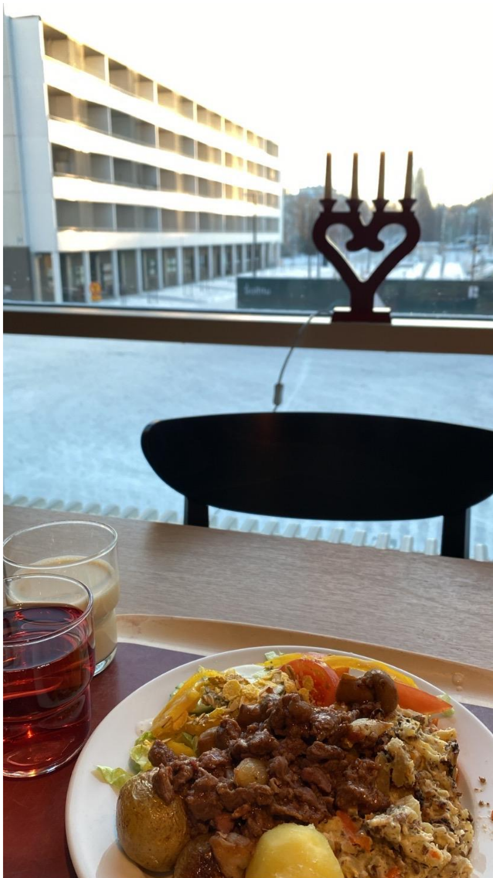
學餐都有大片落地窗很美