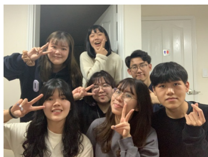
與語學堂的朋友們開派對