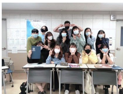
語學堂（密集韓語課程）同學及老師