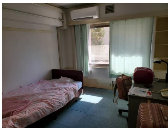
宿舍房間照片(大家都是單人房)

宿舍附近走路 5、6 分鐘的距離有マツモト和業務超市，大家平常都在這裡採購食材或日常用品，旁邊還有兩間 7-11，餐廳雖然不多但有家庭餐廳ガスト和牛丼連鎖店すき家，而且離嵐山也很近，整體來說不算差，只是要去其他地方的話基本上都是搭公車和 JR，可是走到 JR 車站要 15 分鐘，所以推薦可以去 fb 留學生社團買輛二手自行車，省交通費之餘還能順便運動。