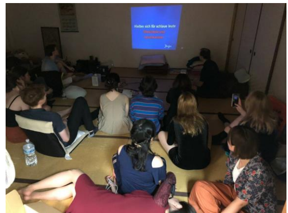
大家一起在榻榻米 room 看電影