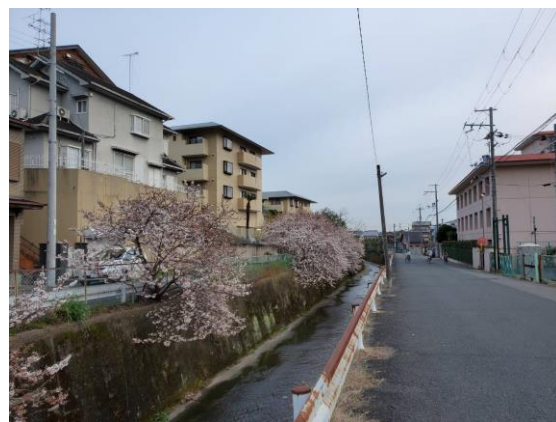
宿舍旁的路(右邊那棟粉色建築就是常盤宿舍)