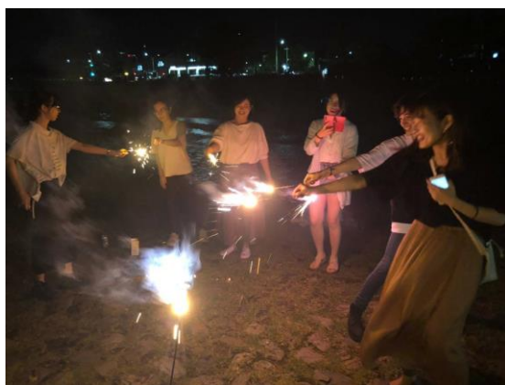
在出町柳三角洲放花火