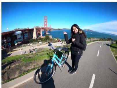
騎單車遊金門大橋