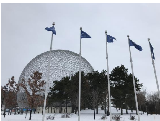
Parc Jean-drapeau Biosphère