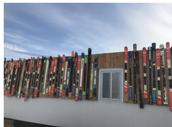
Pente À Neige (交通最易達的滑雪場)