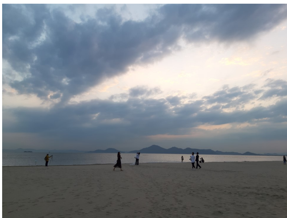
每年 10 月多大浦海水浴場有裝置藝術節，比海雲台乾淨且離學校近