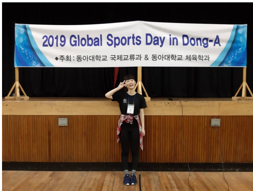
學校跟學伴們舉辦外國學生體育大會，優勝獎品或是參加獎都不錯