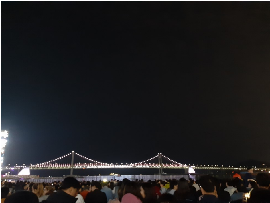
每年 10 月底或 11 月初有釜山煙火節，想看的話要早點去廣安里卡位