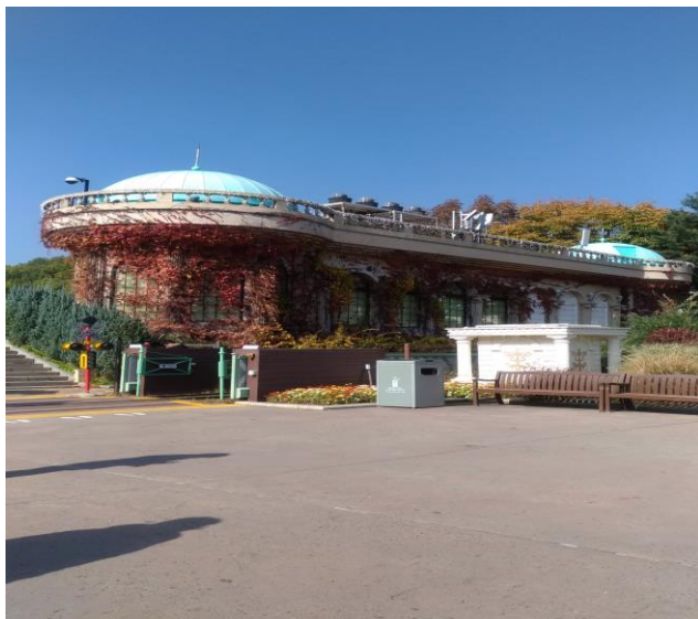
語學堂文化體驗：愛寶樂園