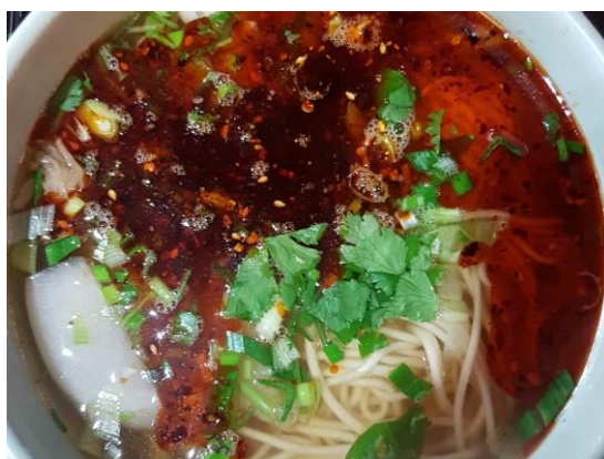
↑ 蘭州拉麵（蘭州牛肉麵）