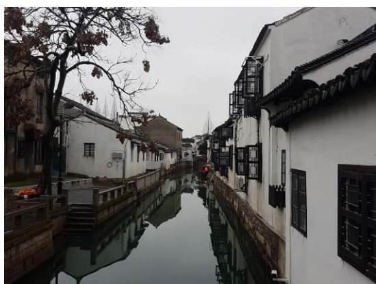
↑ 蘇州平江路歷史街區