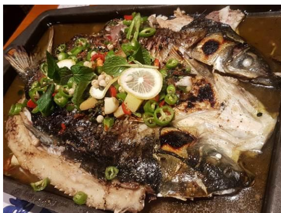
↑ 人大集天餐廳烤魚