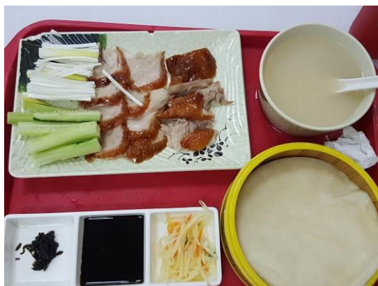
↑ 人大東區食堂烤鴨（16.8 人民幣）