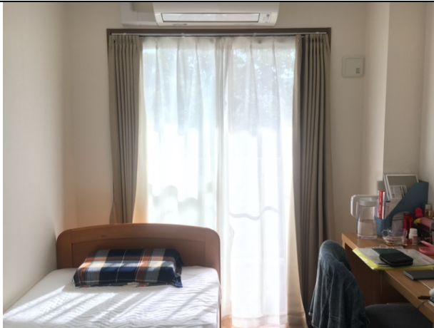
個人房間（枕頭是自己買的）