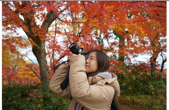
秋天時去京都賞楓！