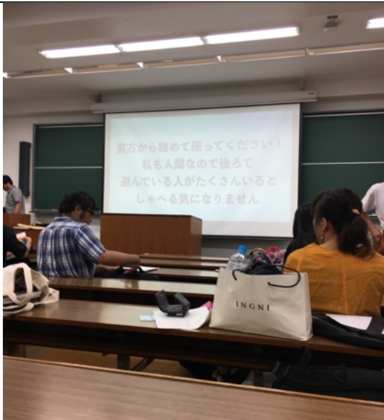
專門科目（個體經濟）教室內