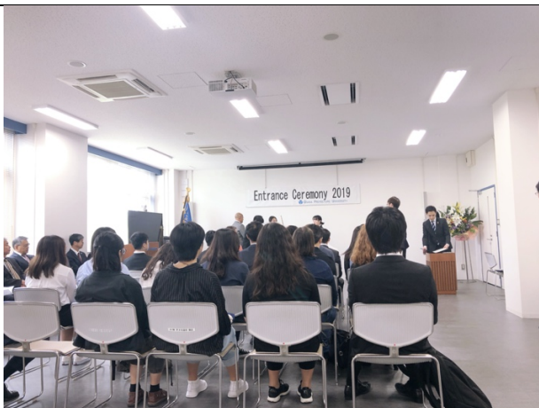
學期開始時會和研究生、博士生一起辦簡單的人學式（需要穿正裝喔！）