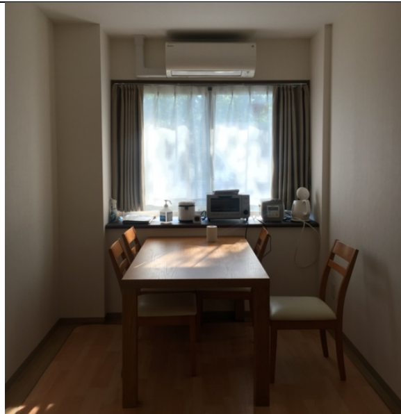
房內的餐聽，有烤箱、電子鍋和熱水壺