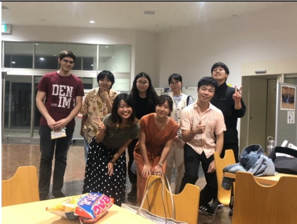
宿舍大廳，大家一起唱完卡拉 OK 回來