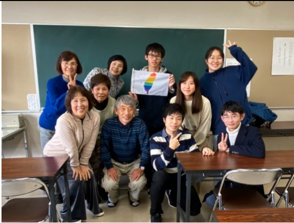
週三下午公民館日本語教室的老師們