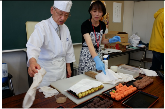
公民館有時會和地方團體合作舉辦文化體驗，這個是和菓子體驗