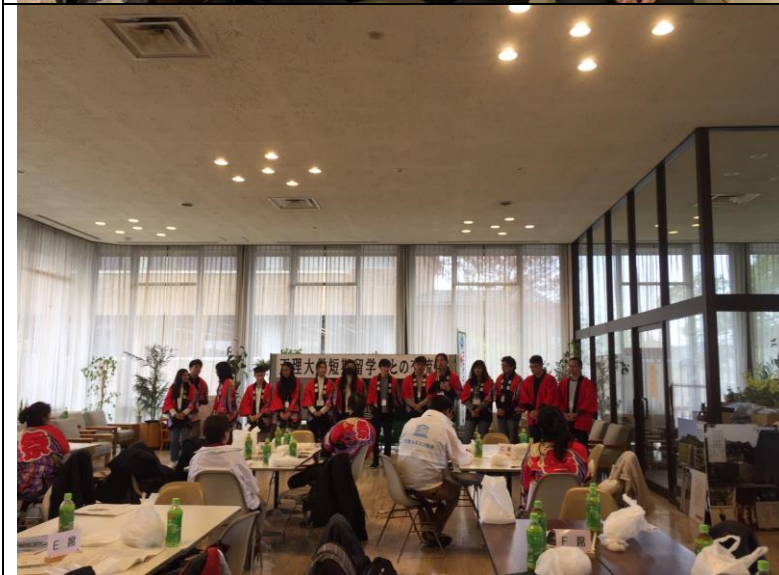
天理市役所（市政府）舉辦留學生與市民的交流活動。當天活動內容是做年糕。