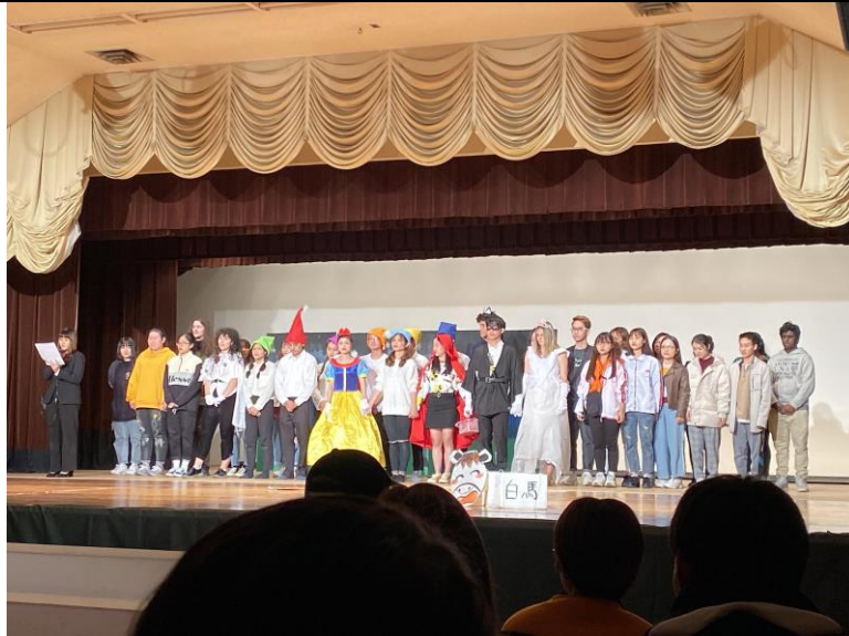
學園祭（校慶）時的戲劇表演。