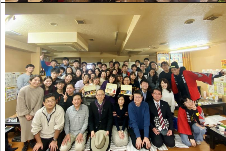
天理大學留學生學會（大和路會）忘年會合照。