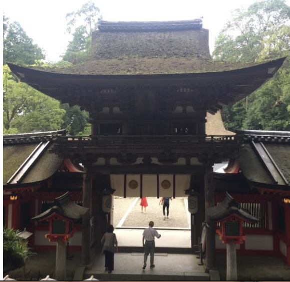
天理當地的名勝：石上神宮。