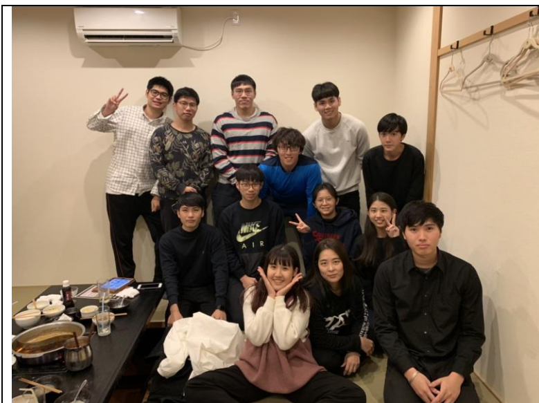
天理大學台灣留學生聚會。