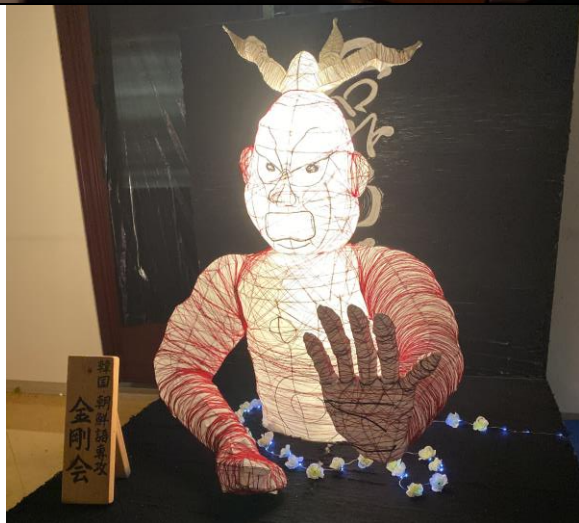
學園祭（校慶）展示由各社團所製作的燈籠。