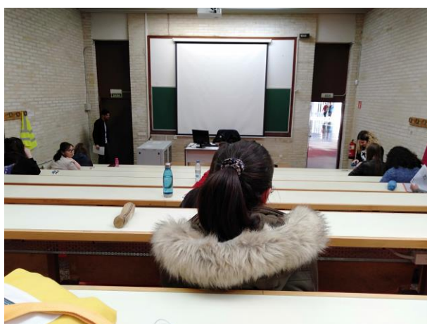
大教室，考試時一排只坐3個人