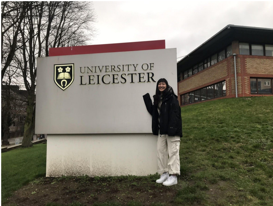
University of Leicester