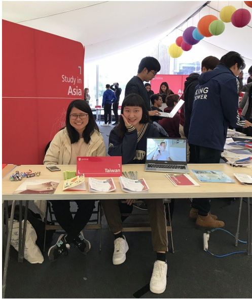
學校的海外留學展 (宣傳Taiwan跟師大)