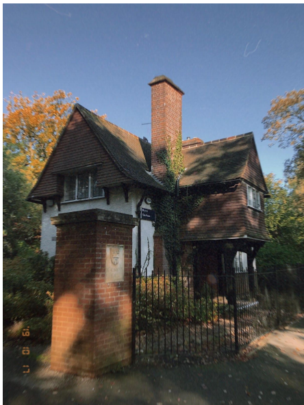
我的宿舍 獨立的old fashion房子 (每棟都長得不一樣!裡面設備很新的)