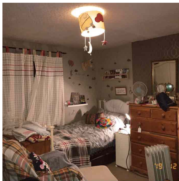
招待我三天兩夜的英國Host家