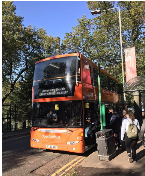
每天接我回宿舍的shuttle bus