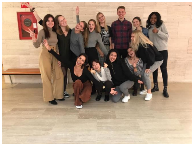
學期制的西文課班上的同學與老師