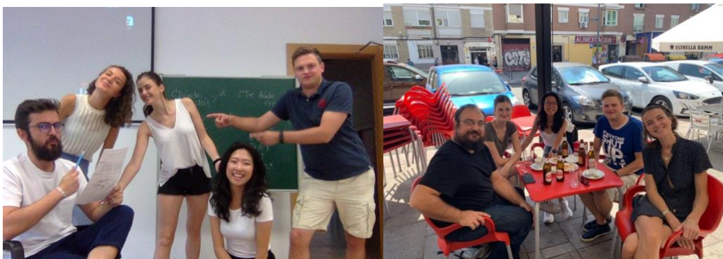
暑期西文班的同學與老師，老師下課後揪我們喝酒聊天

要報名 CUI 暑期西文密集班，進入 頁面 後，資料通常都會在 MATRÍCULA 類別裡，INFORMACIÓN 滑到最下面會有課程簡章；INSCRIPCIÓN 就是報名頁面（會跟簡章同步更新）；LISTA DE ADMITIDOS 就是名單公佈。我當時等名單公佈後，就將學費匯款給 CUI，並將收據傳給 CUI 的 Email 確認付款完成。 這裡 是報名課程的方法以及我從台灣的銀行匯款到國外會需要的資訊。