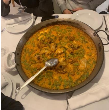
Paella Valenciana—西班牙正統的海鮮燉飯是來自瓦倫西亞（豆、兔肉、雞肉） 海鮮燉飯其實是非正統的～