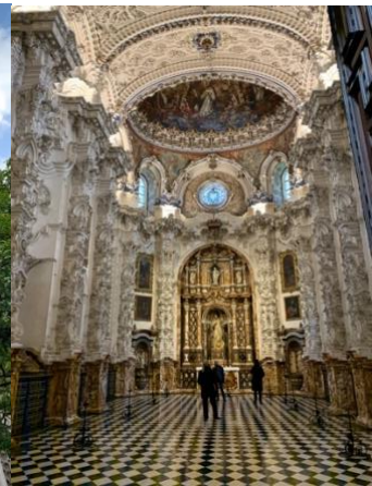
西班牙南部的城市，充滿伊斯蘭風情也深得我心