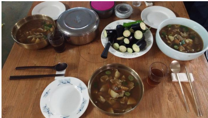
WVVOOFing 時每天吃的家常菜(茄子生吃)