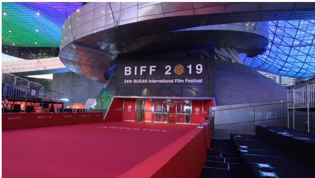
十月我在首爾交換的時候又再回釜山看了電影節