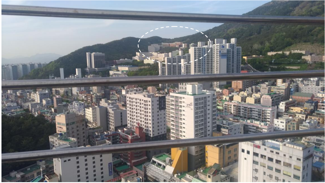
Art-malling 頂樓往宿舍方向看過去(左邊看過去是海)