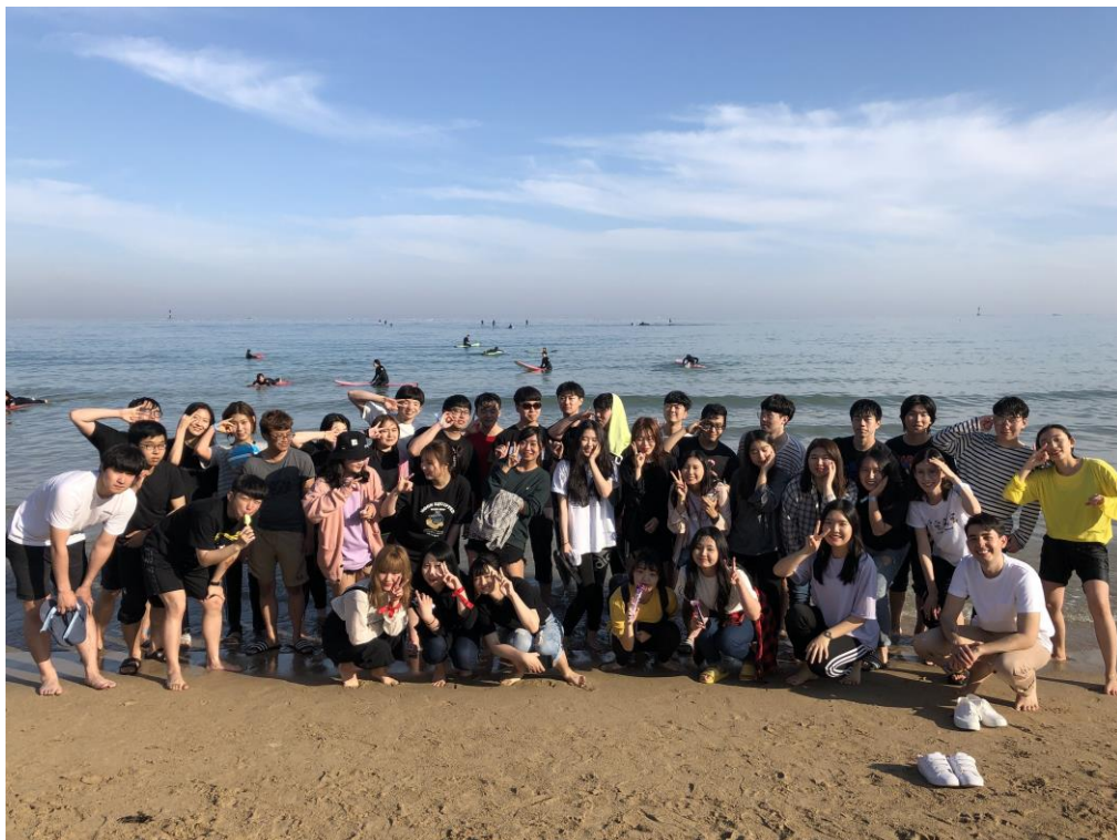
BFFF 的 MT (松亭海水浴場)