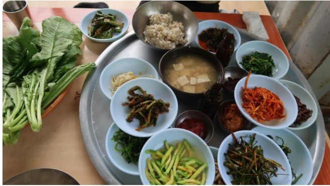
光州無等山有名的蔬菜拌飯