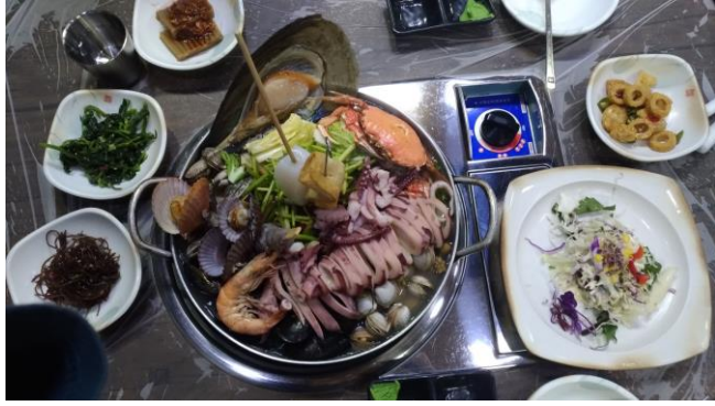
釜山常見的浮誇海鮮料理(해물찜)