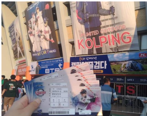
去看熱血的棒球賽 (釜山地主隊是 Lotte)