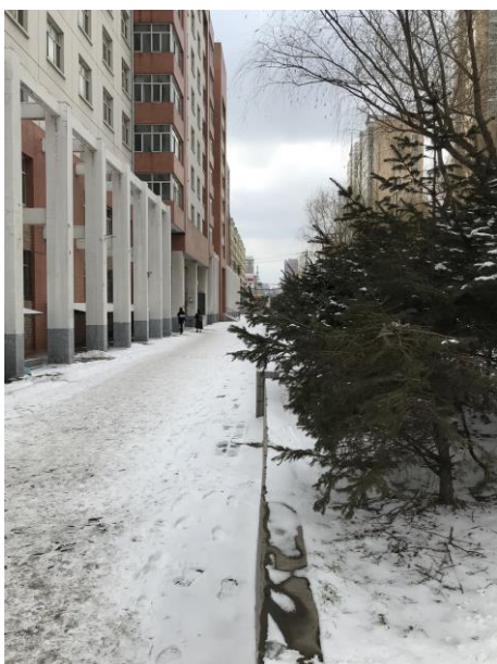
十二公寓旁的雪景