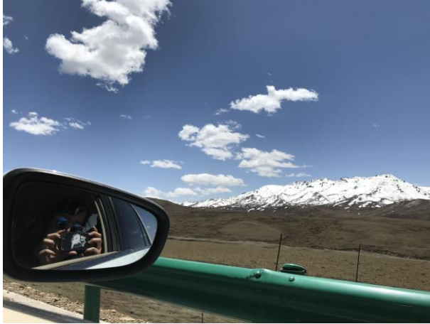
西北之旅路上的風景