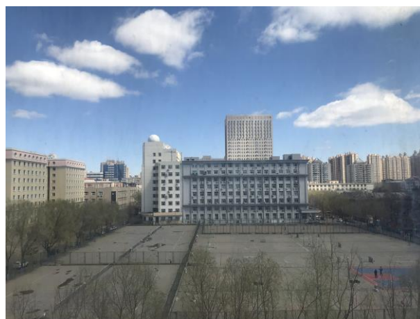
從房間窗戶看出去的風景