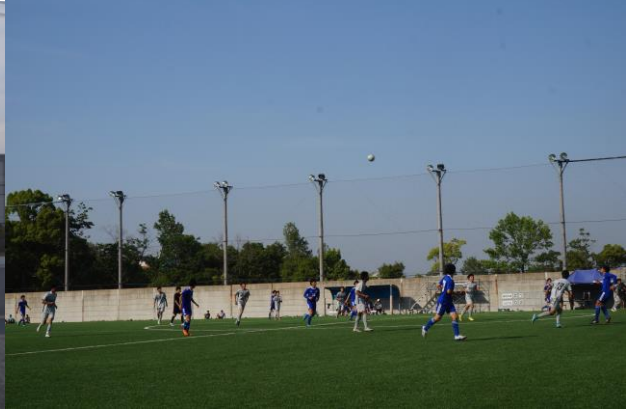
跟朋友一起去看足球比賽(KGU 足球隊)