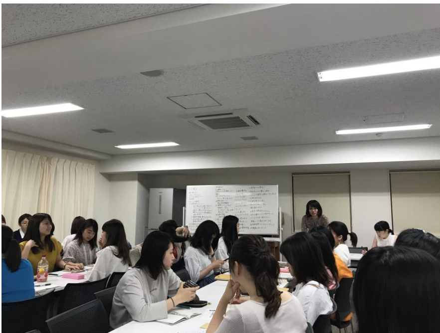
一個月一次的宿舍會議