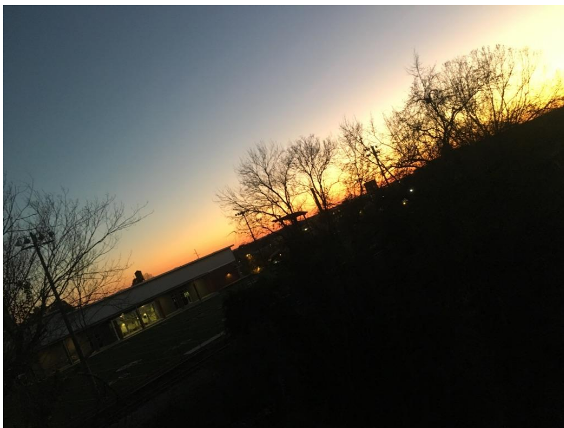
冬天的日落，春假之後就很難看到了。