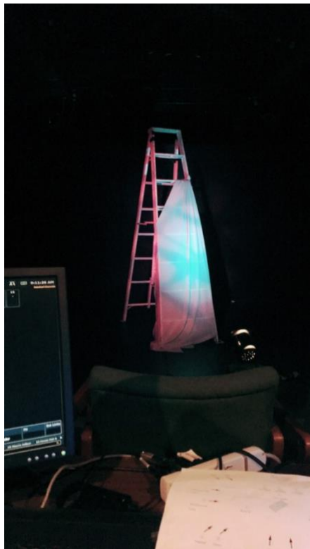
愉悅相處 20 多個小時的梯子兄。