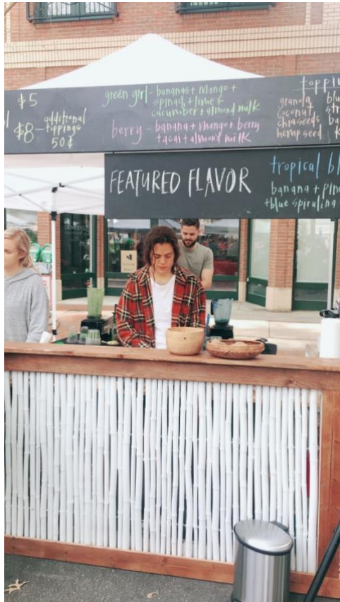
一個假日市集的果昔攤，非常好喝而且超級好喝。