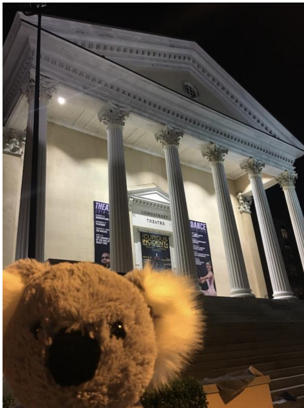
Long Street Theatre

聽說是內戰時期的醫院，看起來很大其實裡面超小的。 老師說他掛燈掛音響掛場佈的時候，會有人在後面摸他的背然後說些心裡話。