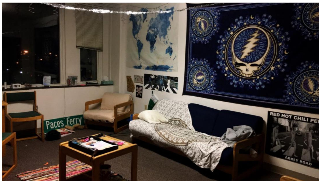
我的第一間宿舍，前室友很迷 Grateful Dead，兩個禮拜我們就搬走了。