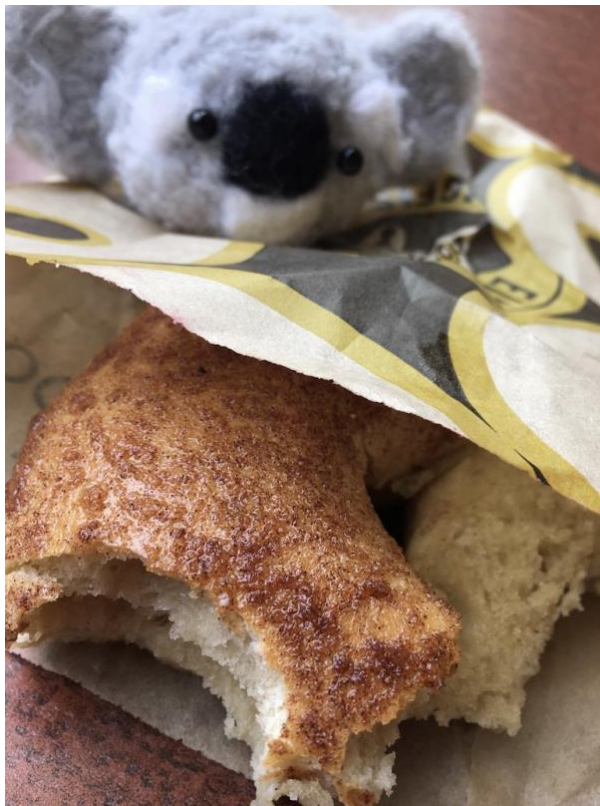
最後的肉桂糖貝果。超… … 好吃…