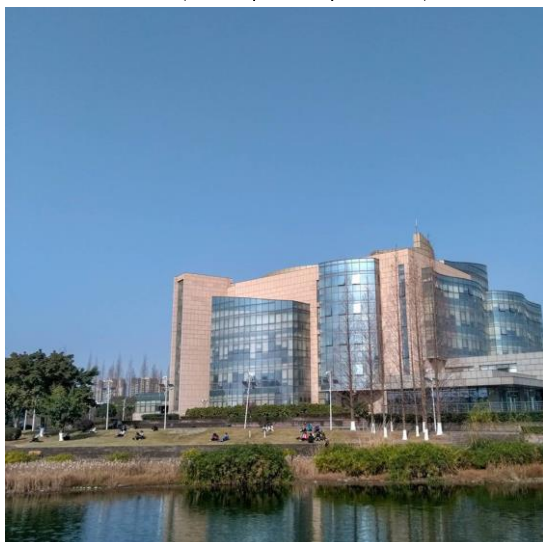
天氣好時的江安校區風景圖書館與長橋↑ 江安新落成的東苑食堂↓