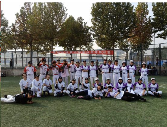
北京師範大學棒壘比賽