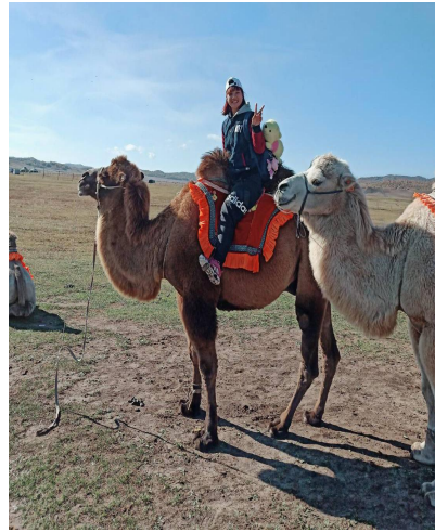
內蒙古體驗騎馬、騎駱駝