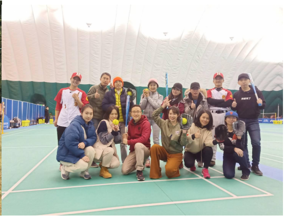
北京棒壘俱樂部擔任指導教練