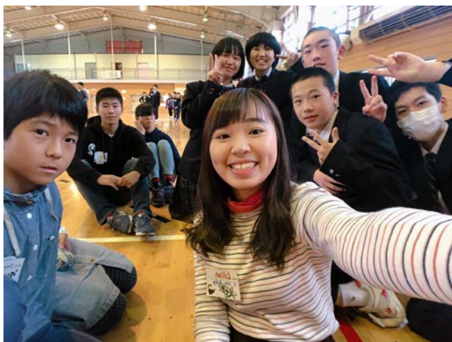
▲與國中、小學生交流。