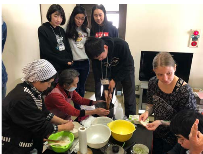
▲參加 green tourism 體驗手作料理。