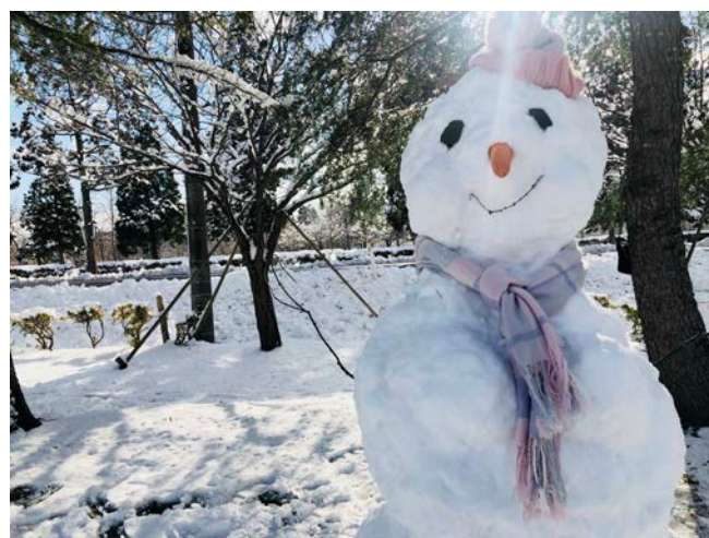
▲堆了一個超大的雪人。