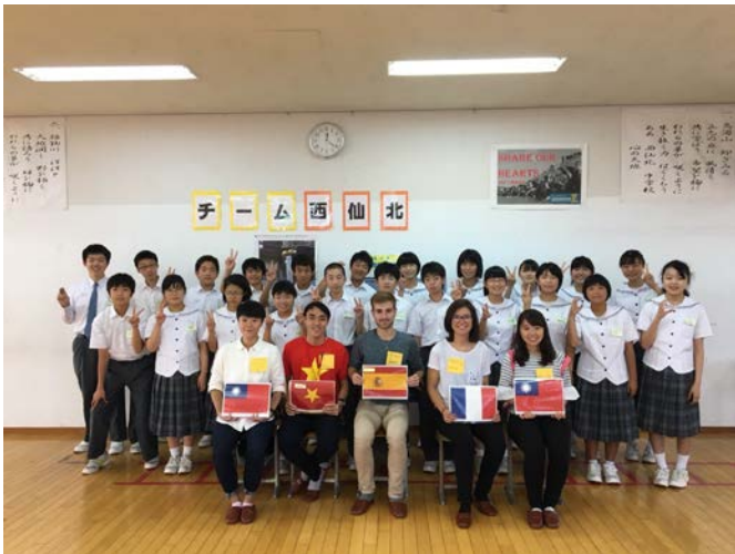
▲到西仙北中學校交流。