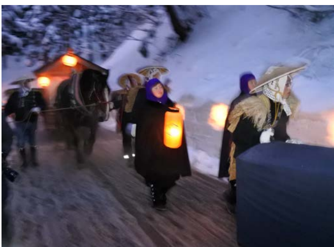
▲參加秋田縣羽後町的傳統慶典。