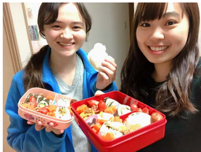
▲在宿舍做日式便當。