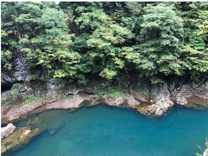
▲Themed house 校外教學—白神山地。