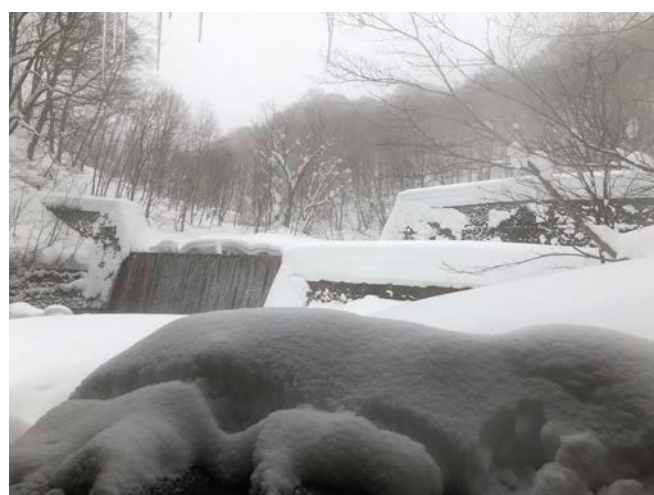
▲冬天的乳頭溫泉(妙乃湯)。