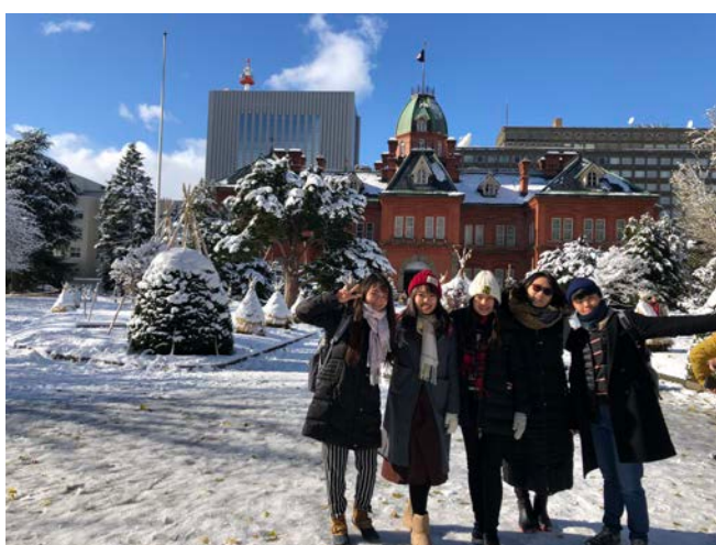
▲北海道旅行(秋田有航班直飛札幌)。