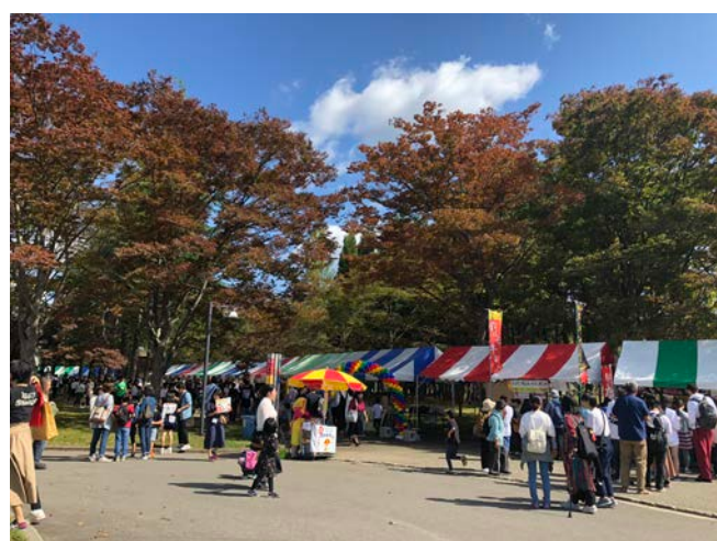
▲AIU Festival 大學祭。