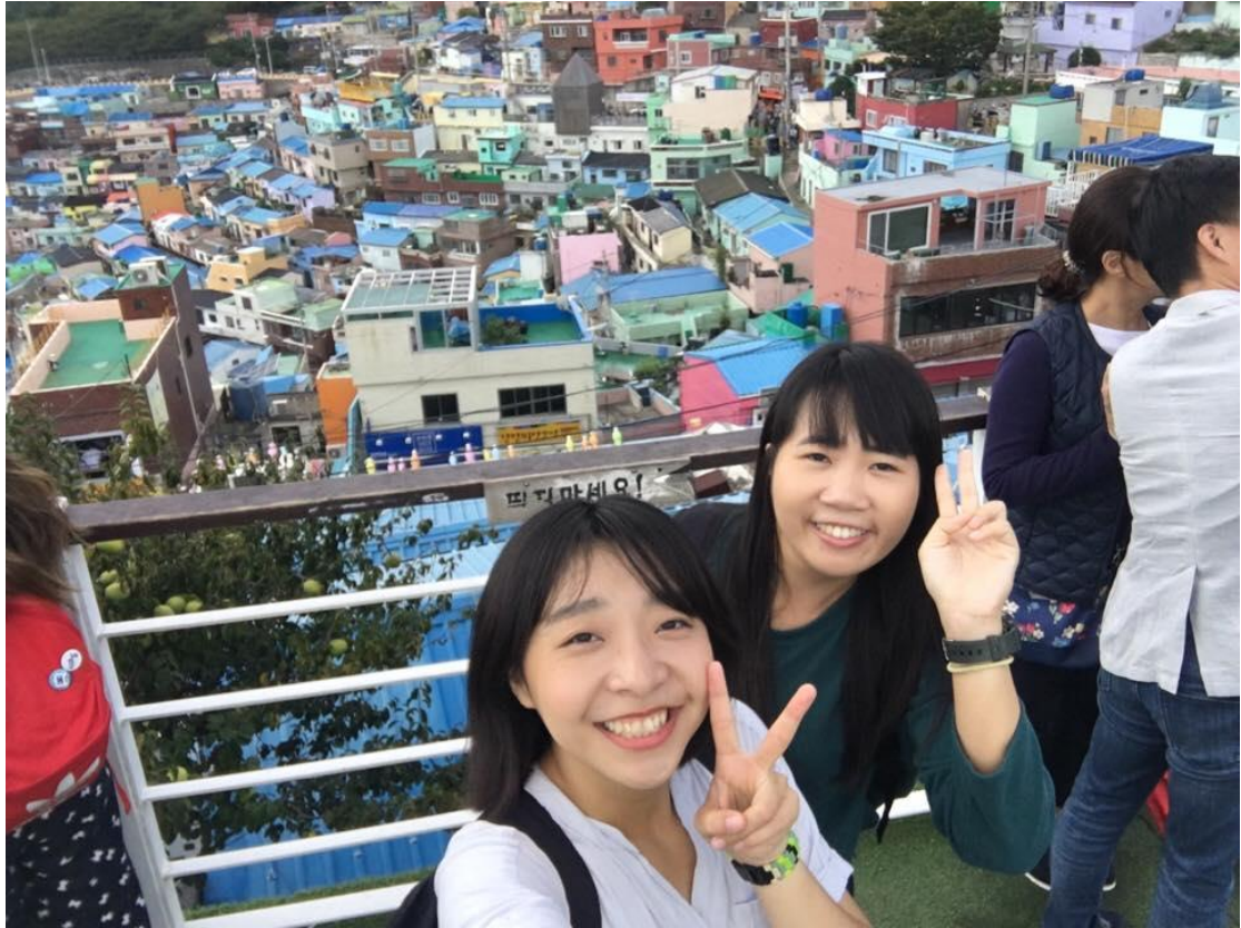
和朋友一起去釜山玩