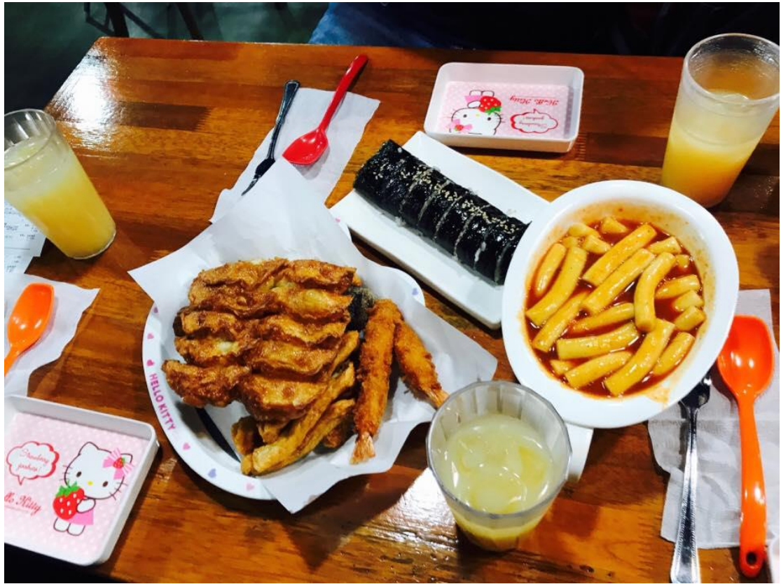
學校附近的年糕店！