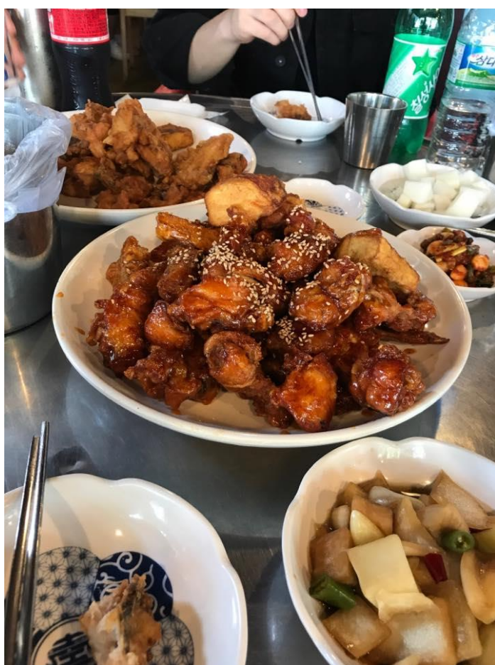
宿舍活動【大邱一日遊】時的午餐炸雞