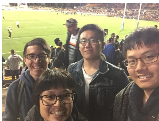
Rugby Wests Tigers V.S Sea Eagles