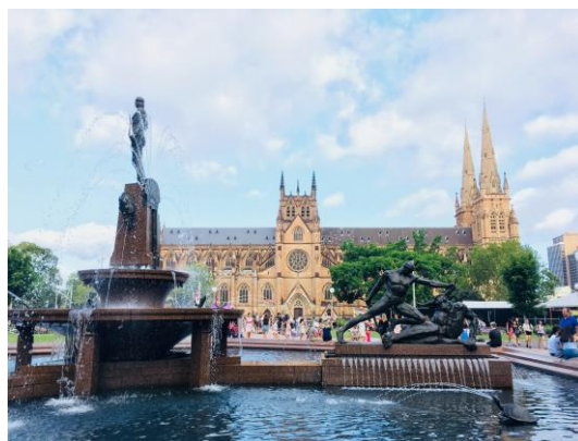
St. Mary's Cathedral