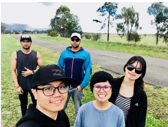
Self-drive road trip