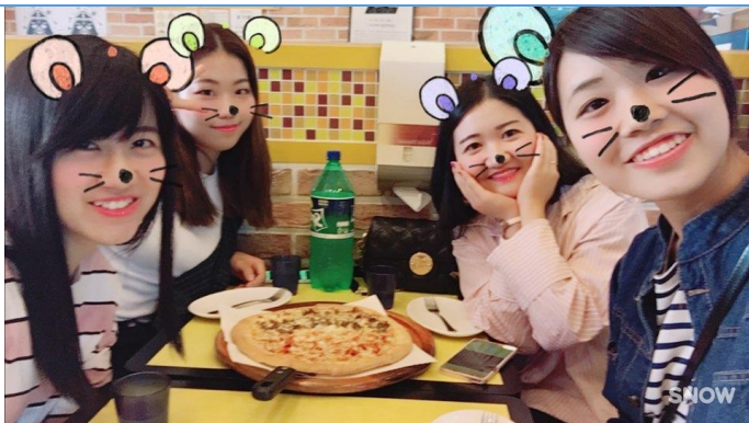
✿與韓國朋友的聚會