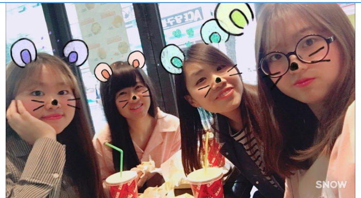
✿與韓國朋友的聚會