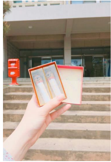
✿語學堂老師送的離別禮物