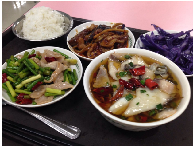
湖南的酸菜魚是我的最愛！