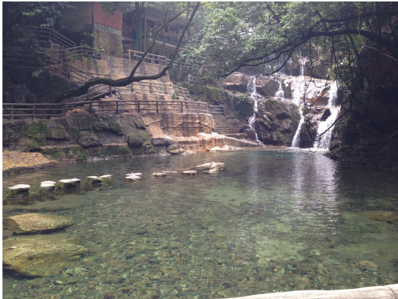
據說，孫中山先生以前在這瀑布游泳過。