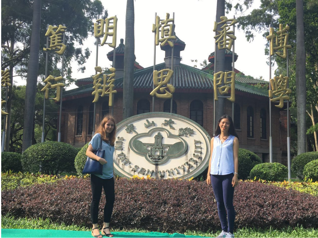
我最愛的南區校園

我之所以選擇這所大學是因為我想要學習在自然條件很好的地方，剛好中山大學符合我想要的條件，因而選擇了它。（當然其他因素也有啦！）我認為中山大學是非常有魅力的大學，中大的自然環境特別好，不但每天可以呼吸到新鮮的空氣，還可以聽著鳥鳴及蟲鳴上課，過了不久，我愛上了中大南校區綠油油的草坪，瀟灑著花樹味道的校園了。