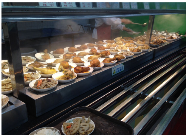
每天可以吃到不一樣的美食