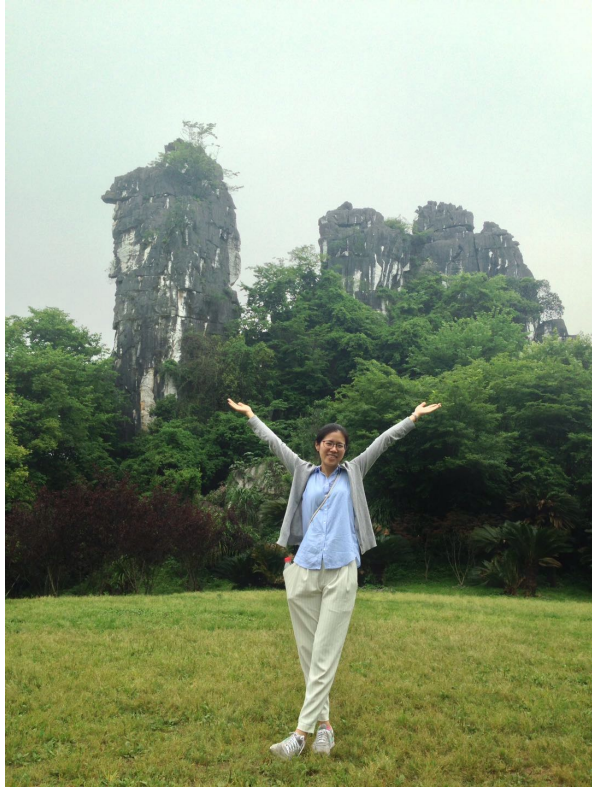
後面的岩石長得像駱駝嗎？哈