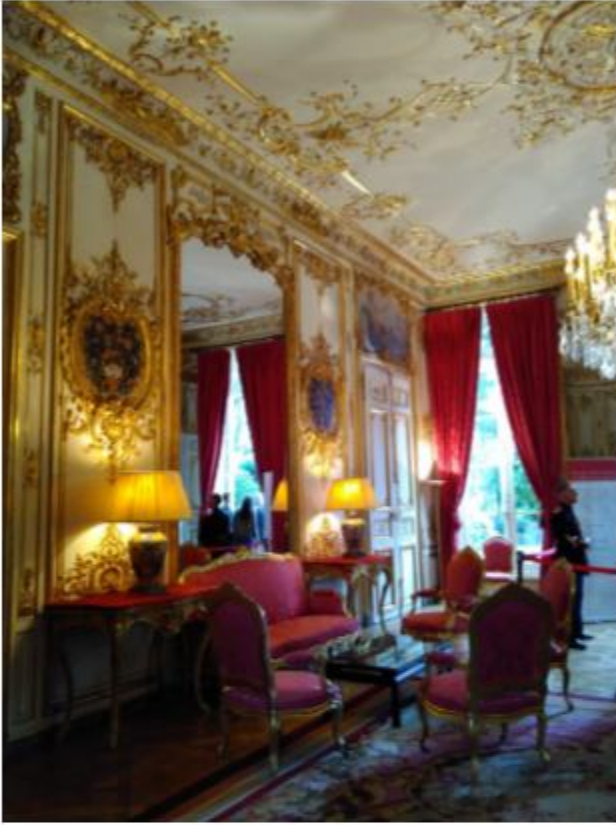
十一月參觀法國遺產日 首相官邸(一)