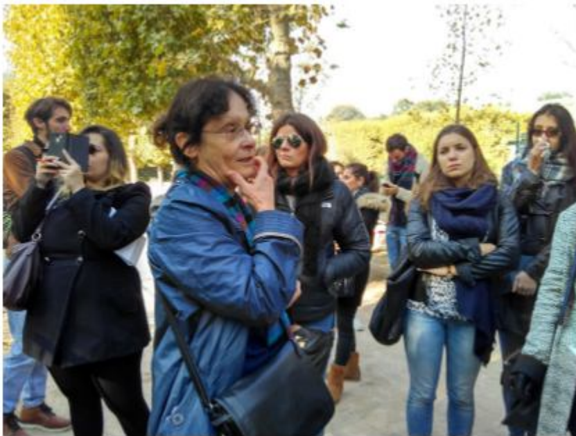
園林史 與教授和同學參觀巴黎植物園（一）