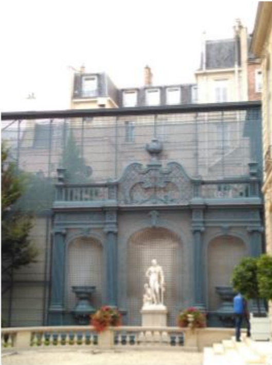
十一月參觀法國遺產日 首相官邸(二)