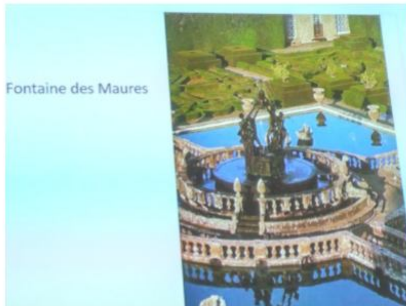
上課時使用的幻燈片(一)