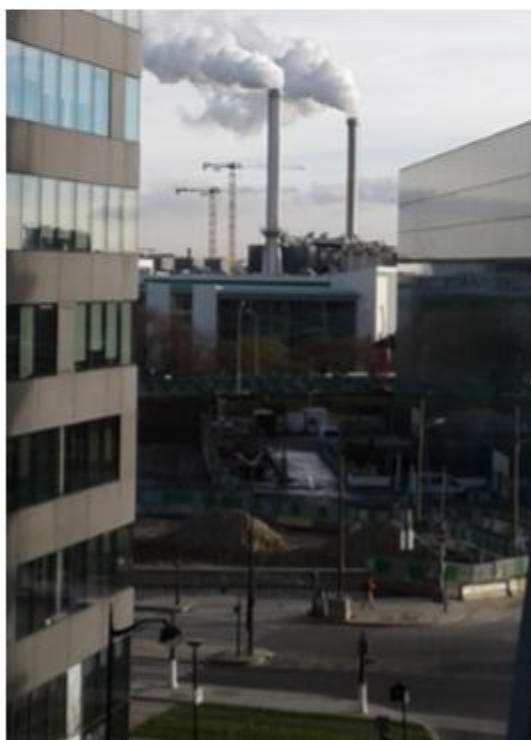
宿舍外的兩根大煙囪