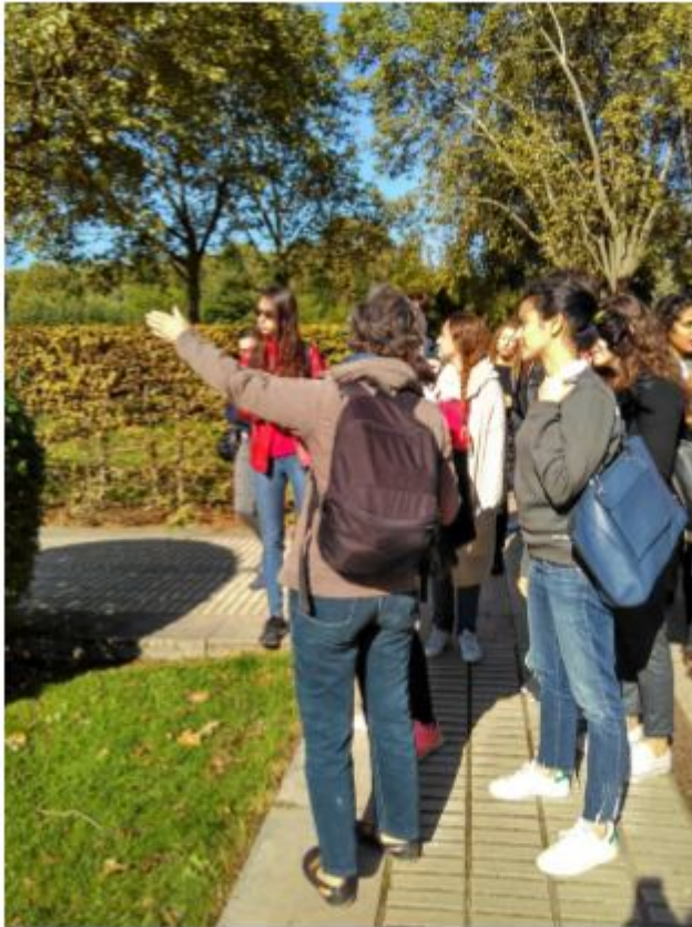
與教授和同學參觀巴黎 Bercy 花園 (一)