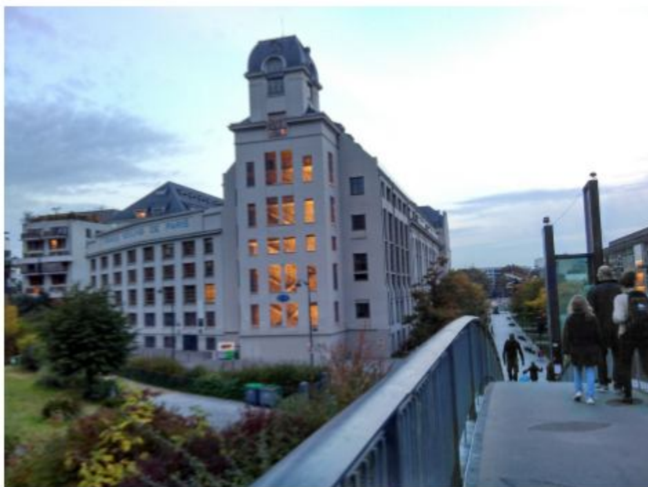
巴黎七大主建物 這裡的地形高低起伏 低地是塞納河畔