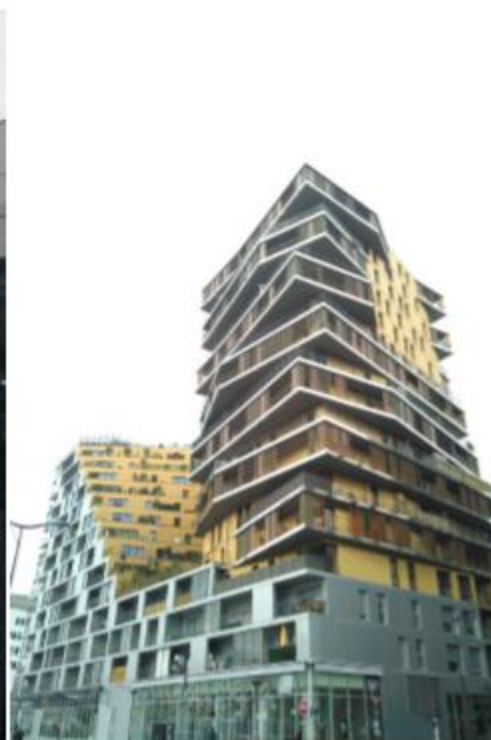
宿舍的前棟 具有創意的建築物