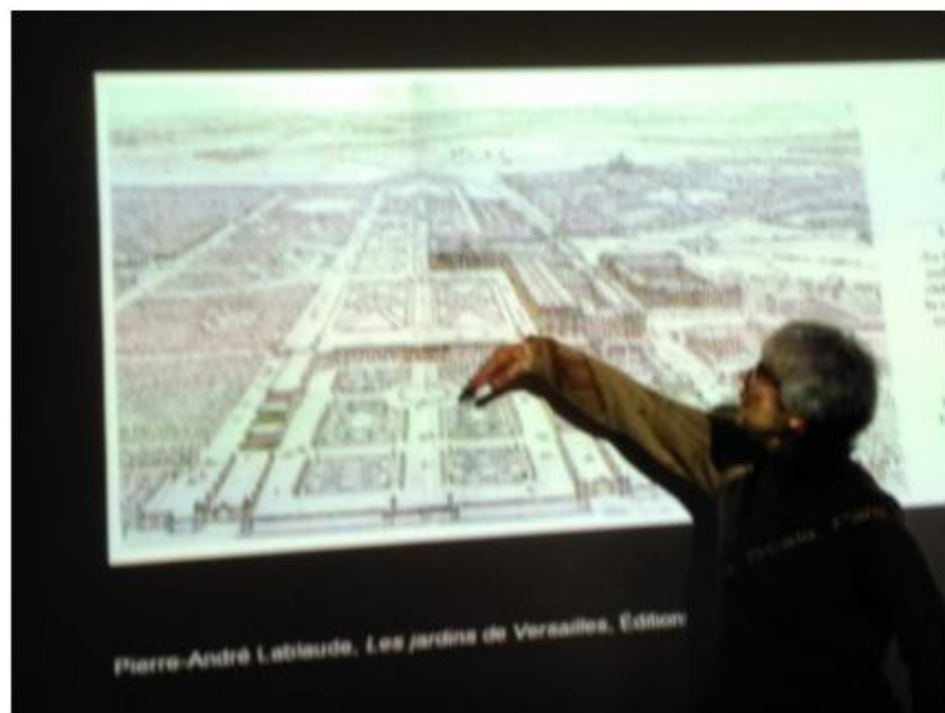
上課時使用的幻燈片(二)