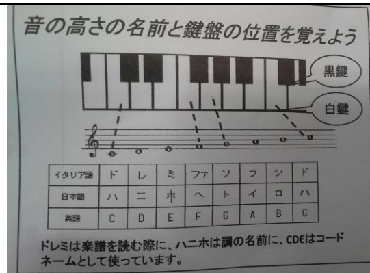
日本的 Do re mi