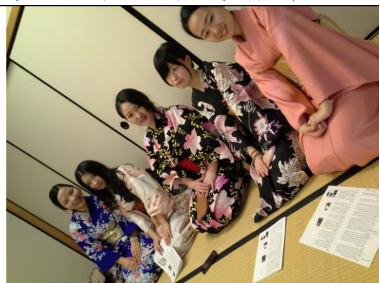
日本語課文化體驗