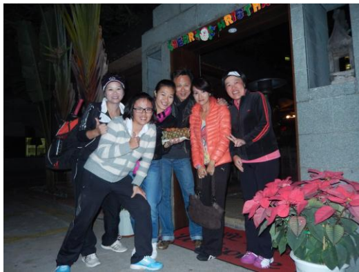
與香港網球球友聚餐