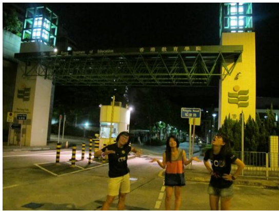
從大埔河濱公園走上教院（累死）