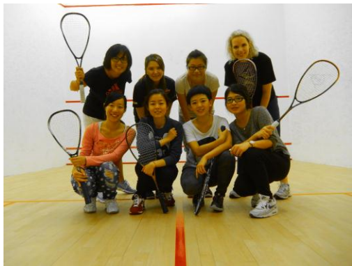
秋季壁球班—與同學合影