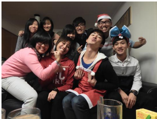
聖誕節在隊友家開 Party