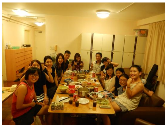
中秋節－交換生在 JC 宿舍下廚