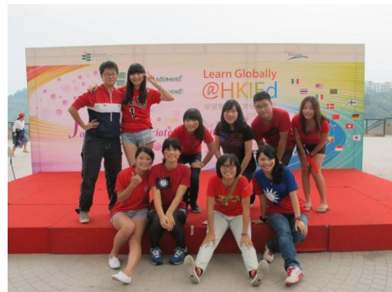
國際教樂日－台灣交換生