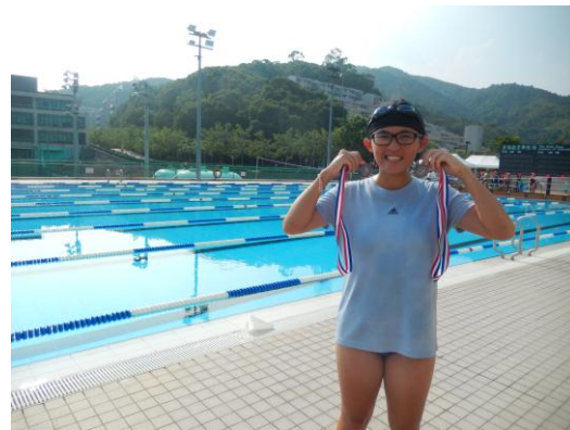
水運會拿了三面銅牌(游泳池超棒)