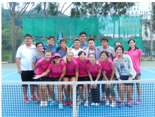
香港大專盃網球賽－HKIED 男女合影