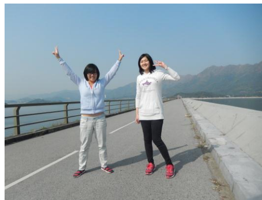
離港前，從大埔墟騎到大美督水壩