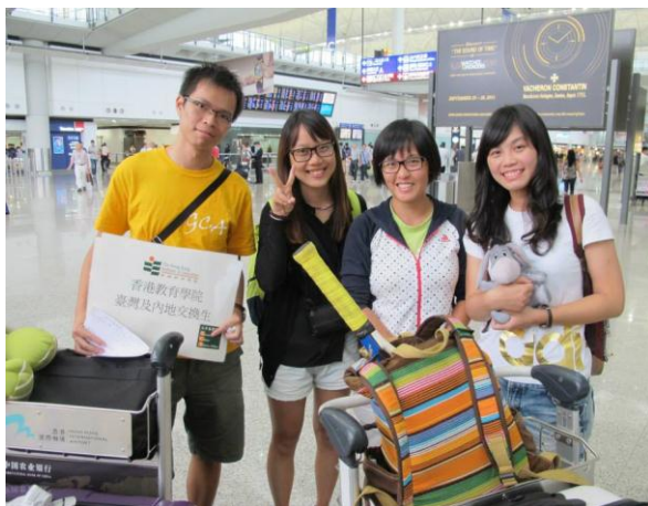
2013. 08. 30 抵港