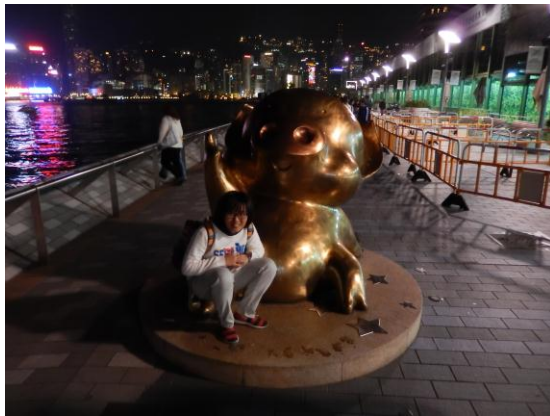
星光大道與麥兜合影