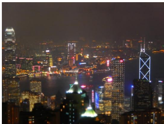
大中華事務處－太平山夜景