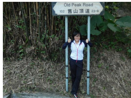
健走經舊山頂道上太平山