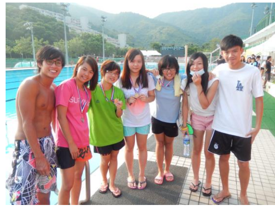
水運會接力銅牌—與隊友們合影