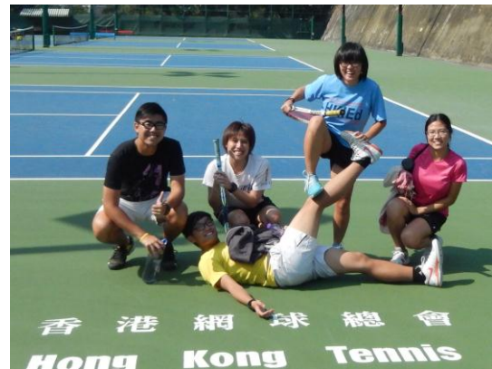
香港網球總會—幫忙網球教練考試