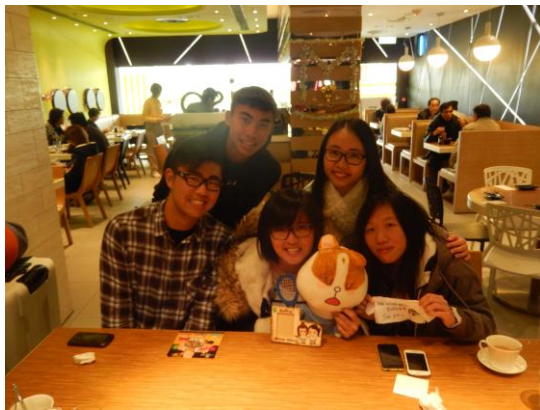
離港前，網球對聚餐