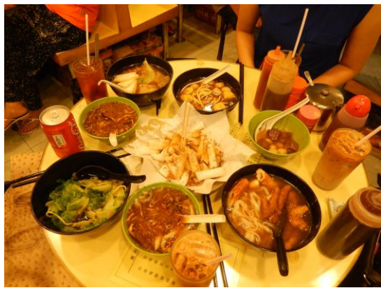
大埔中心吃碗仔翅、撈麵、腸粉