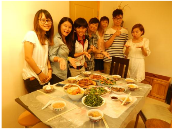
到師大朋友家作客—整桌家常菜