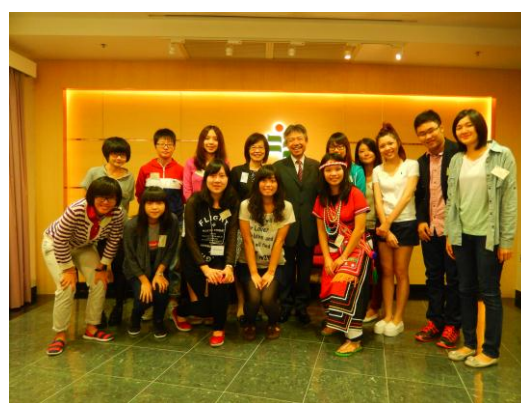
台灣交換生與張仁良校長合影