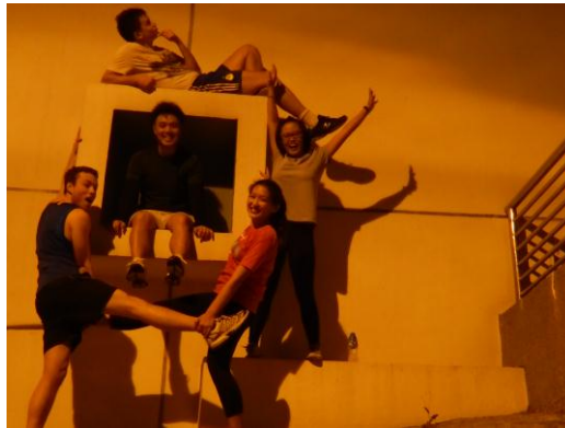
與朋友夜跑上太平山