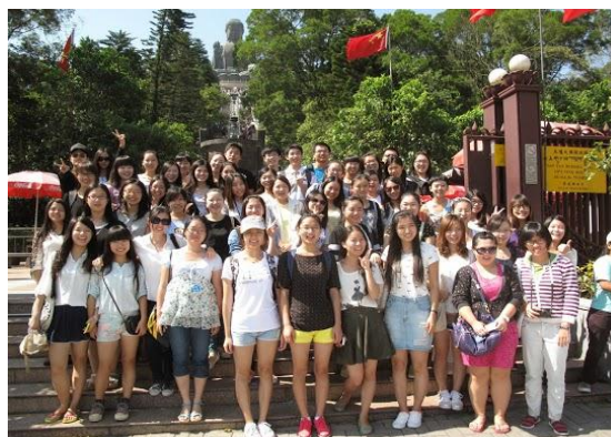
大中華事務處－大嶼山大佛