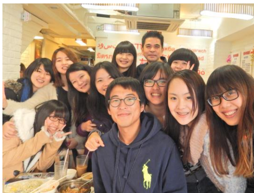
離港前，與朋友們在旺角聚餐