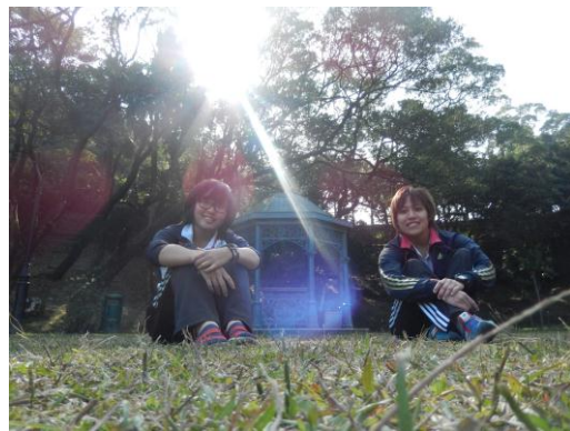
與朋友上太平山祕密花園