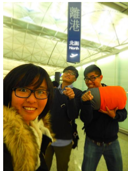
2014. 01. 02 離港