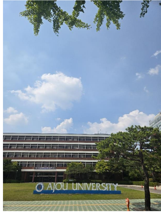
學校春天漂亮櫻花