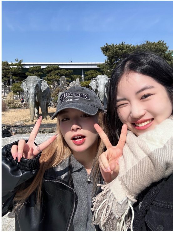
(和學伴一起逛校園)