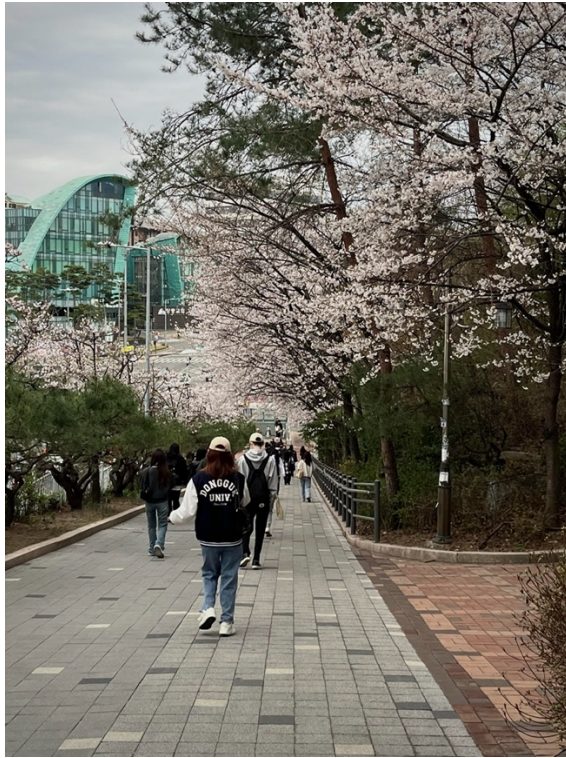
( 櫻花季 )