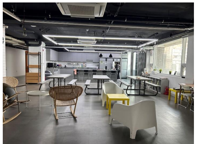
Haebang Tower 四人房