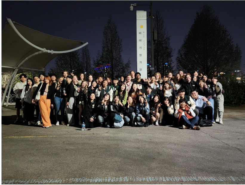
Kite 期中漢江野餐聚會