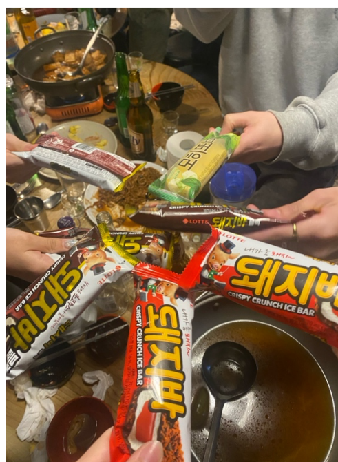
Ggun 期初聚餐時大學長送的解酒冰棒