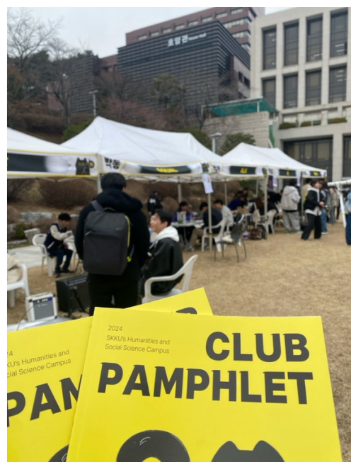
學期初的社團博覽會