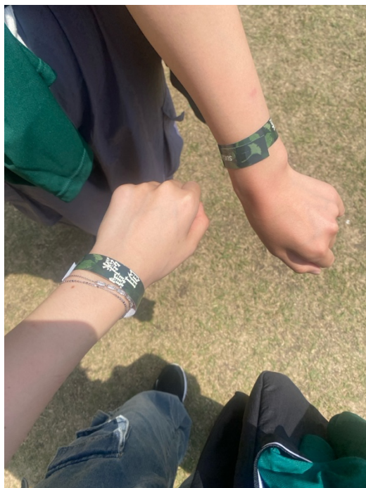
和室友一起去的水原校區校慶