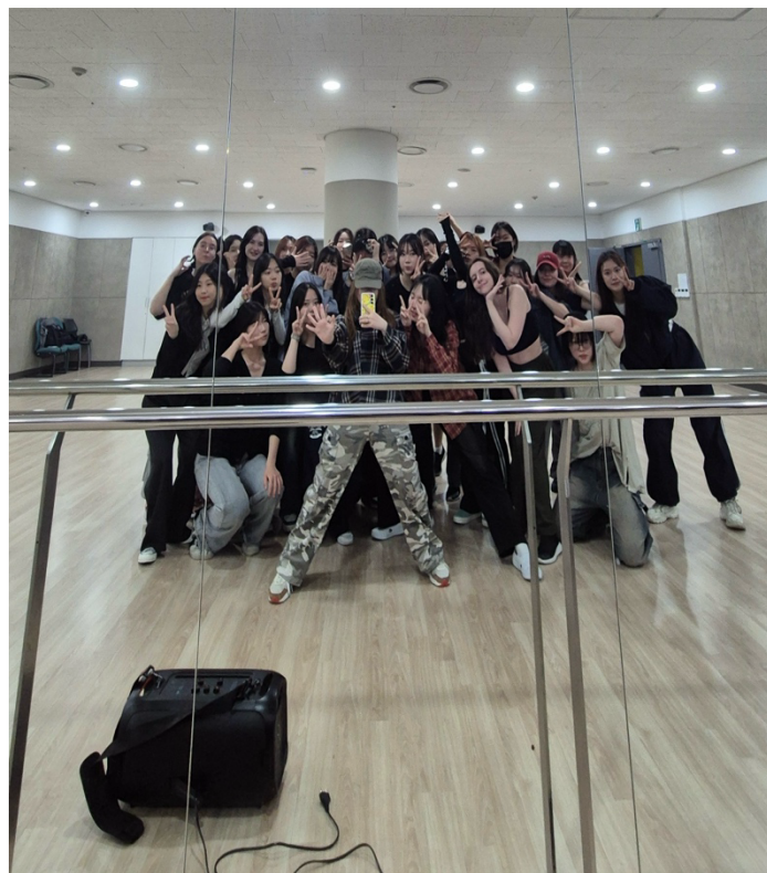
Girls hip hop 社課結束後的大合照