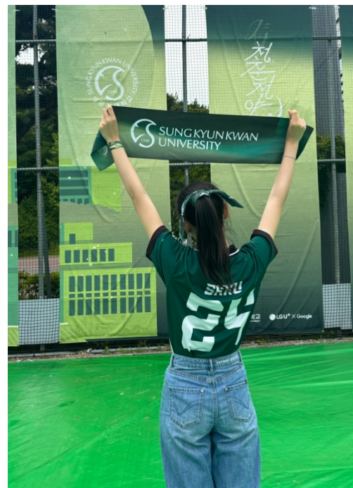
全身成均館週邊的首爾校區校慶