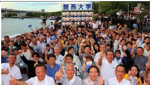
天神祭關大丸(抽籤)