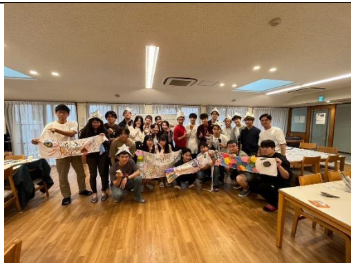
宿舍兒童節鯉魚旗活動