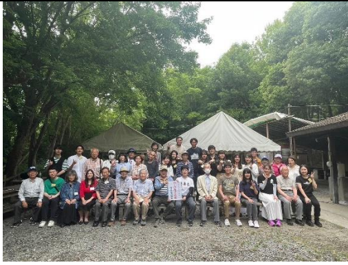
吹田日台友好協會烤肉活動