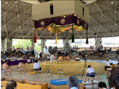
西日本相撲比賽 關大也有參賽