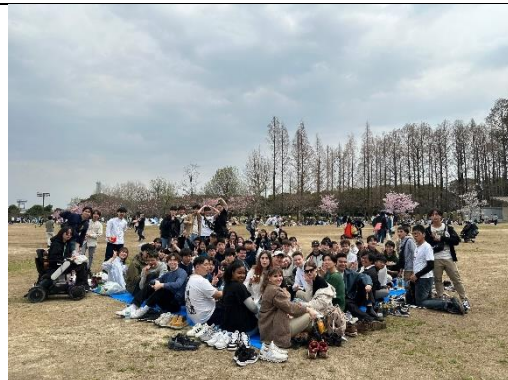
宿舍春天賞櫻活動