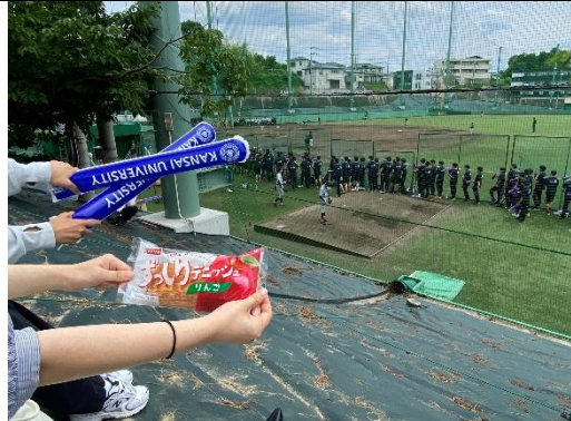
關大與關學的野球比賽