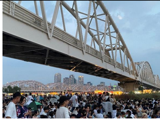
淀川花火大會現場