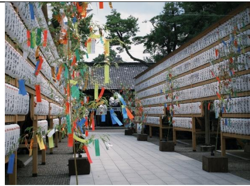
北野天満宮北野祭