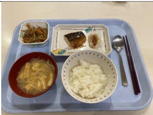
宿舍早餐 日式餐點