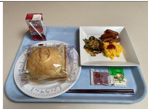
宿舍早餐 西式餐點