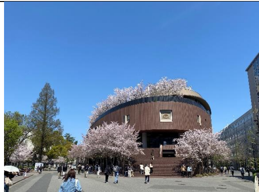
春天的關大真的非常美!!!