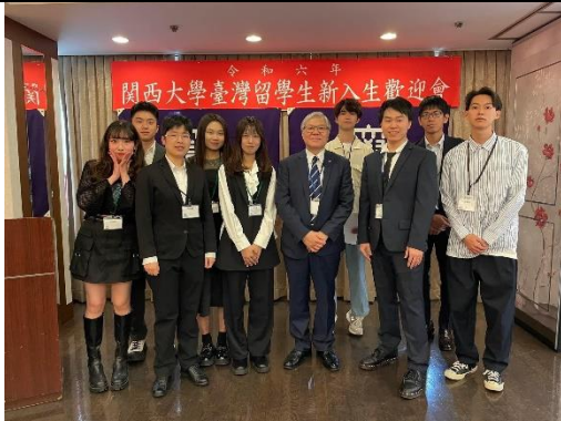
擔任關大台灣留學生會聚餐工作人員