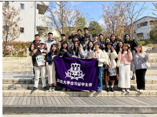
關大台灣留學生會校園導覽