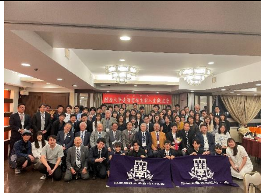
關大台灣留學生會聚餐