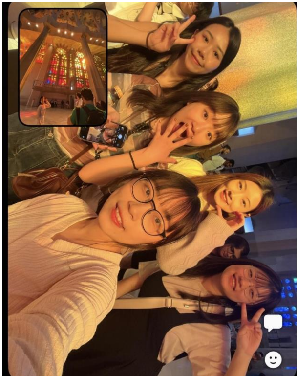
西班牙巴塞隆納/聖家堂