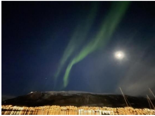
挪威 tromso 極光