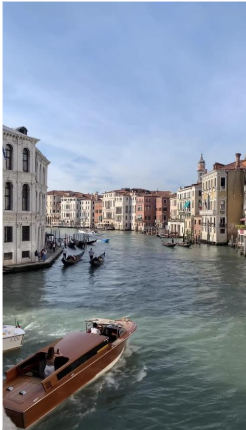
義大利威尼斯 我超喜歡