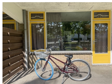
陪伴我度過整段交換期間的小紅