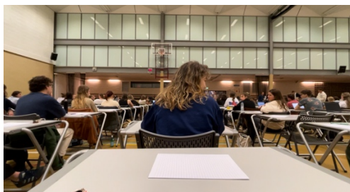
在 Sport center 考試的盛大景況