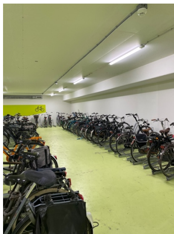
校內附設地下停車場