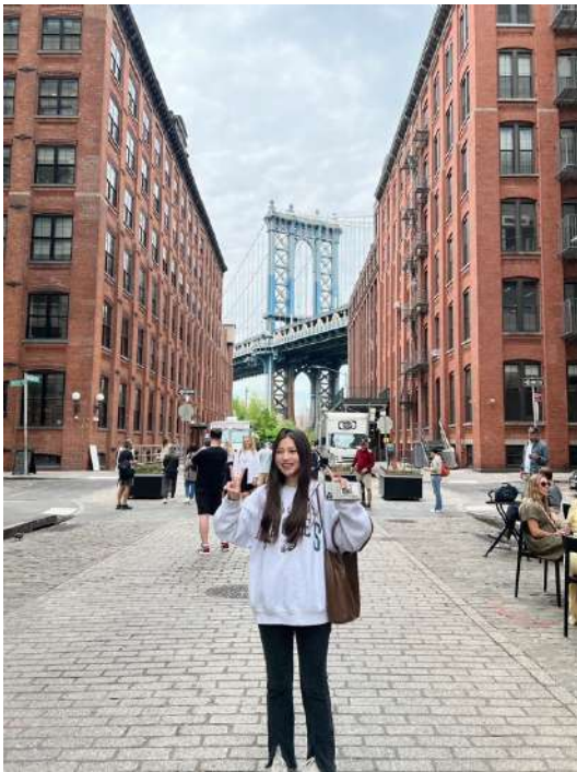
▲ 紐約布魯克林大橋