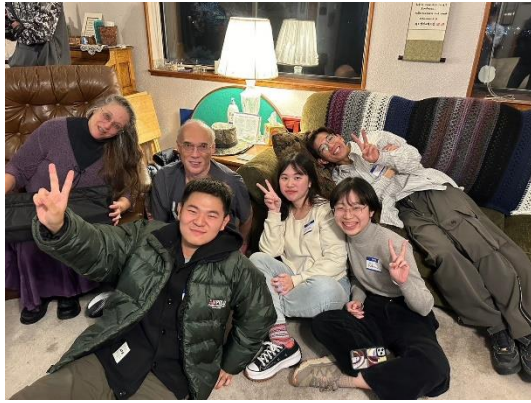
Kris 家 Sunday Night