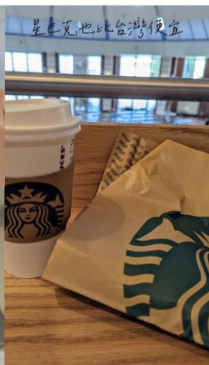
星巴克也比台灣便宜