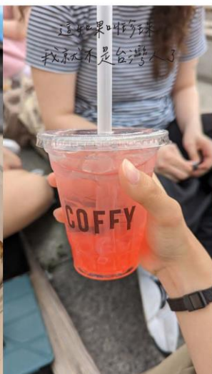
這如果叫珍珠 我就不是台灣人了