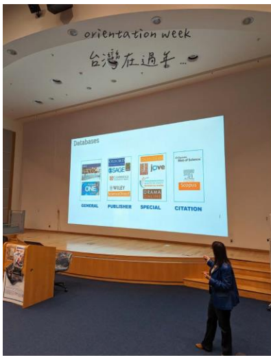
orientation week 台灣在過年...