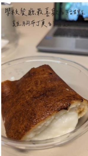
學校餐廳最喜歡吃甜 美且月的布丁莫白