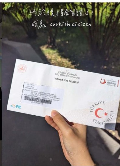
終於獲得居留證了! 成為 turkish citizen