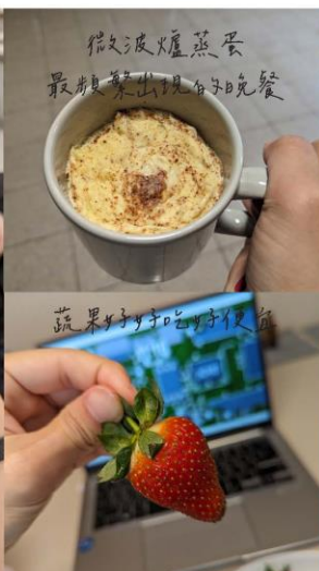
微波爐蒸蛋 最後裝出現白粥晚餐 蔬果好字好字便飯