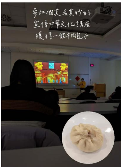
參加個莫名其妙的 宣傳中華文化講座 獲得一個牛肉包子