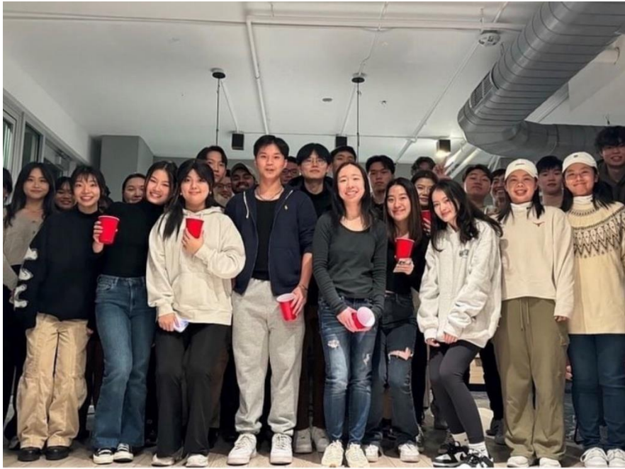
Taiwanese International Student Association