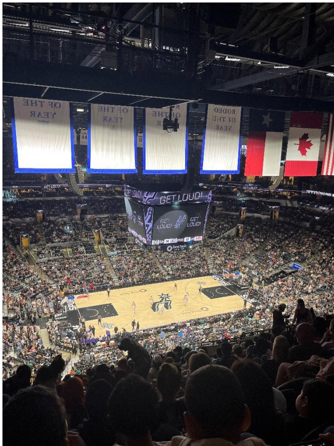
NBA, San Antonio