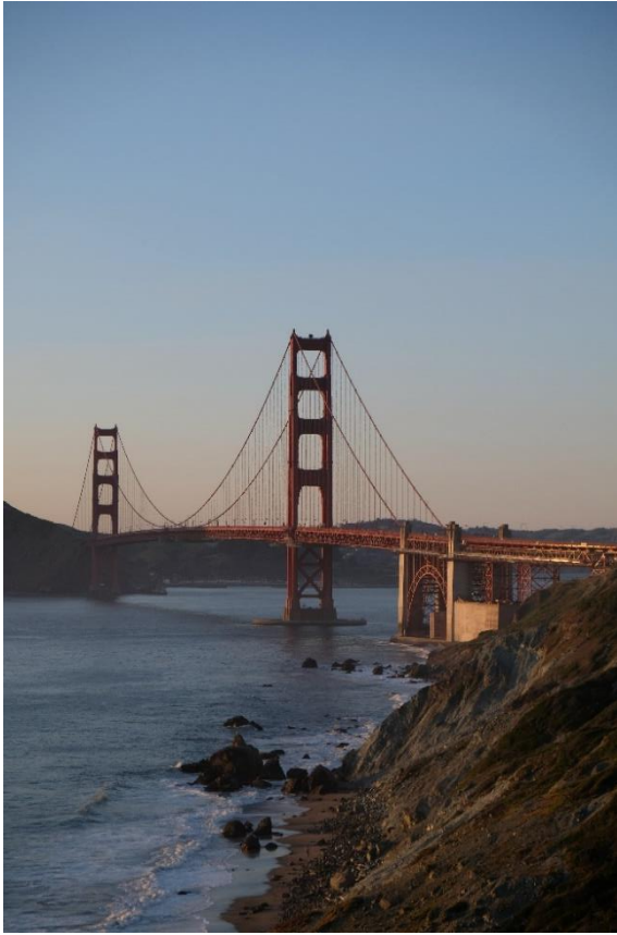
Golden Gate Bridge