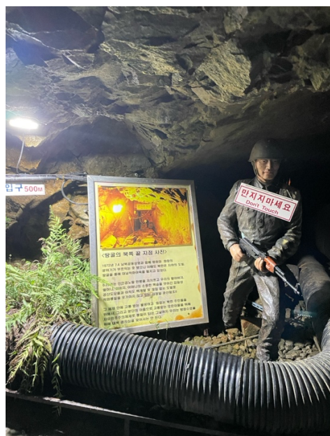
學校安排給交換生的 DMZ TOUR