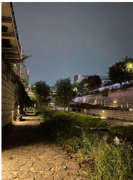
適合散步的清溪川