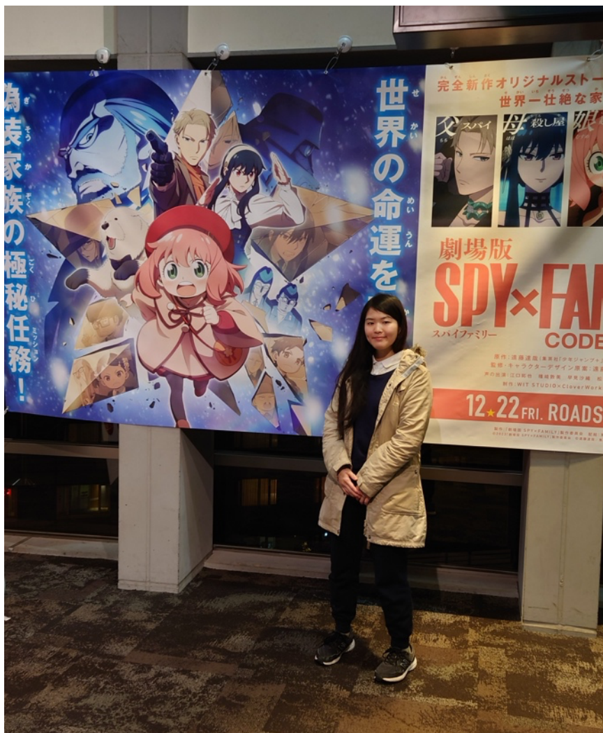
與 Host Family 過日本新年