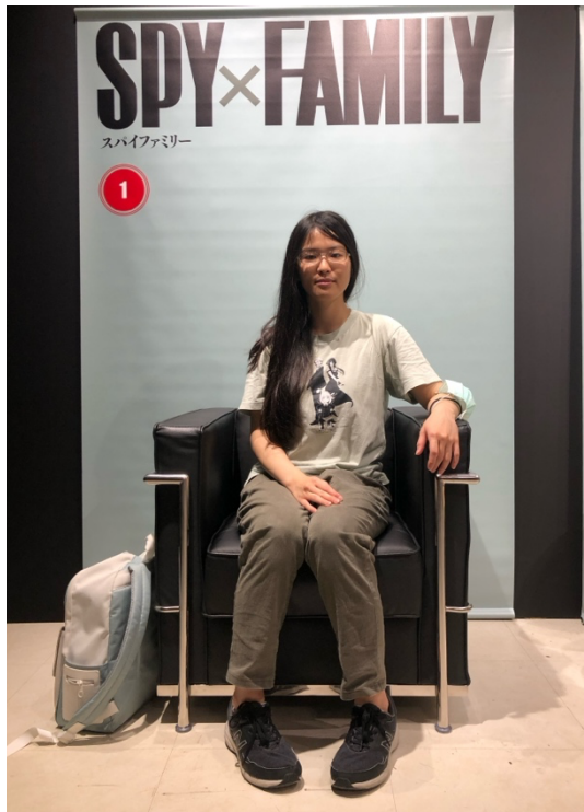
Spy X Family 福岡展