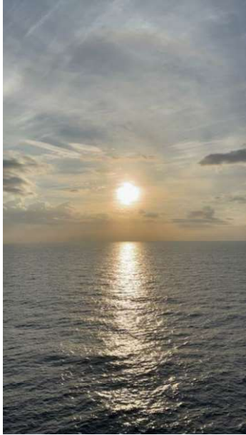
日本國內船班上觀賞日出 (北海道苫小牧 to 茨城県大洗)