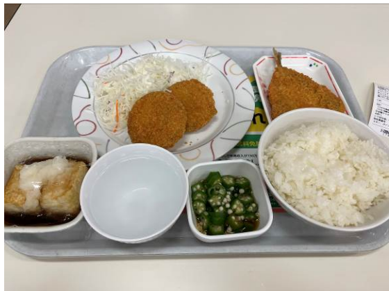
北海道大學學生餐廳的餐點