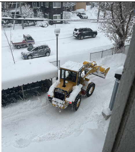
除雪車出沒在宿舍樓下