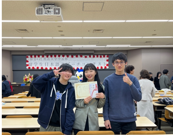
演講比賽與組員的合照