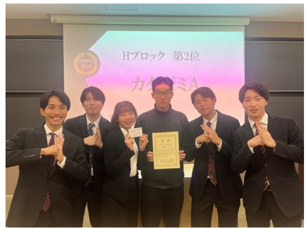
(圖左是救火組、圖右是原本那組)

* 學業上，我花在唸書的時間其實蠻多的，主要也希望好好的認真念，所以真的建議大家如果日語沒有那麼熟的情況下，可以多留點時間給自己～然後有報告或發表，盡量參加，可以練習自己的膽量跟組織能力我覺得都蠻不錯的。