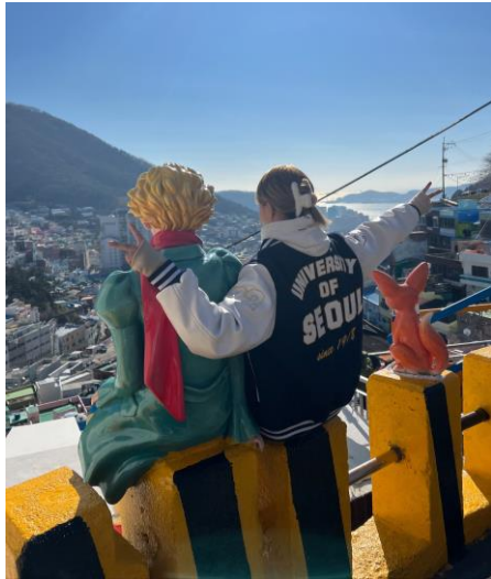
到釜山去旅行~學校的棒球外套真的很好看！ (這裡是甘川文化村)