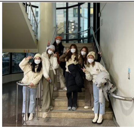
到 KBS 電視台參觀~是很多偶像拍過照的那個樓梯!