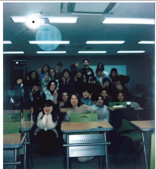
期末最後一堂韓文課 全班大合照~