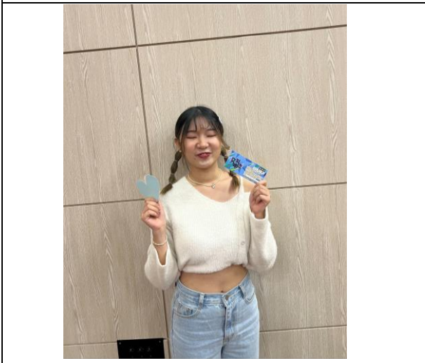
我獲得個人獎~獎品是 Music bank 入場券!