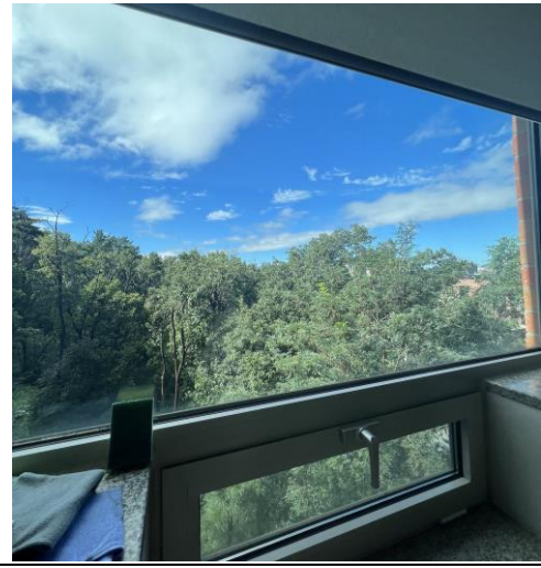
宿舍有大片落地窗~超漂亮(7F)