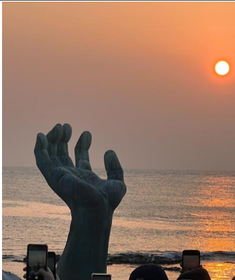
2023 年第一道日出！(浦項)還因此上了電視 XD