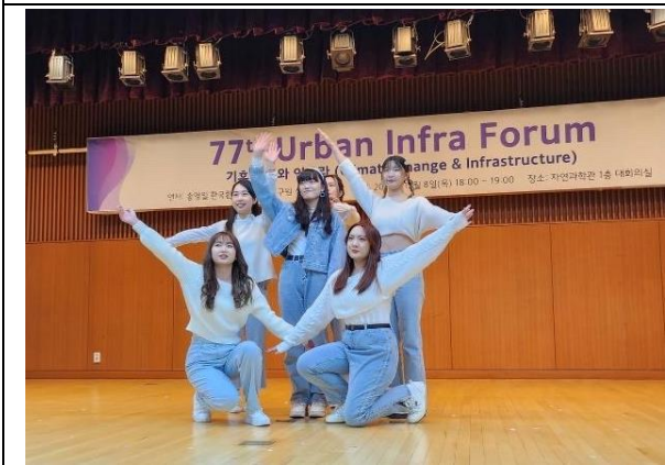
大眾媒體文化課期末 KPOP 舞蹈比賽