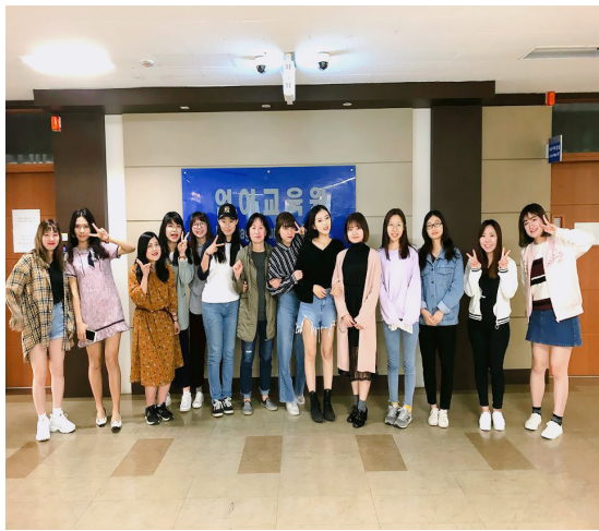
* 和語學堂的老師與同學們合照！

另外，語學堂會在接近 TOPIK 考試前開設 TOPIK 考試衝刺班，上課時間會在晚上（詳細情形因為我沒有上不太清楚），學校可以幫大家團體報名 TOPIK 考試，需直接到國際交流處報名繳費（40000 韓幣），但是學校只幫忙報名中高級的考試，若要考初級必須以個人名義報名，強烈建議來交換的同學可以趁在韓國有很多練習機會，語言實力最好的時候報名參加韓語檢定考試！學校報名的好處是通常可以在釜山考試，以個人名義報名可能必須到其他城市參加考試。（有同學到大邱跟首爾考試）