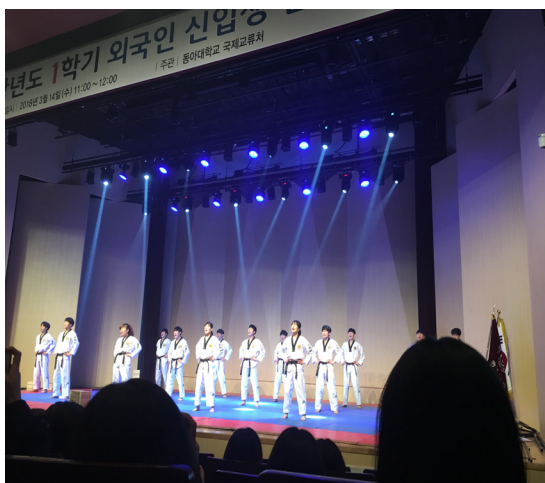
* 開學典禮學校跆拳道系的公演