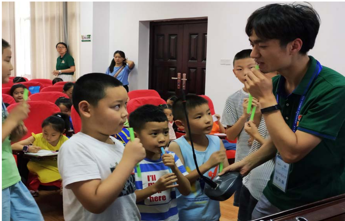
自製樂器-吸管排簫