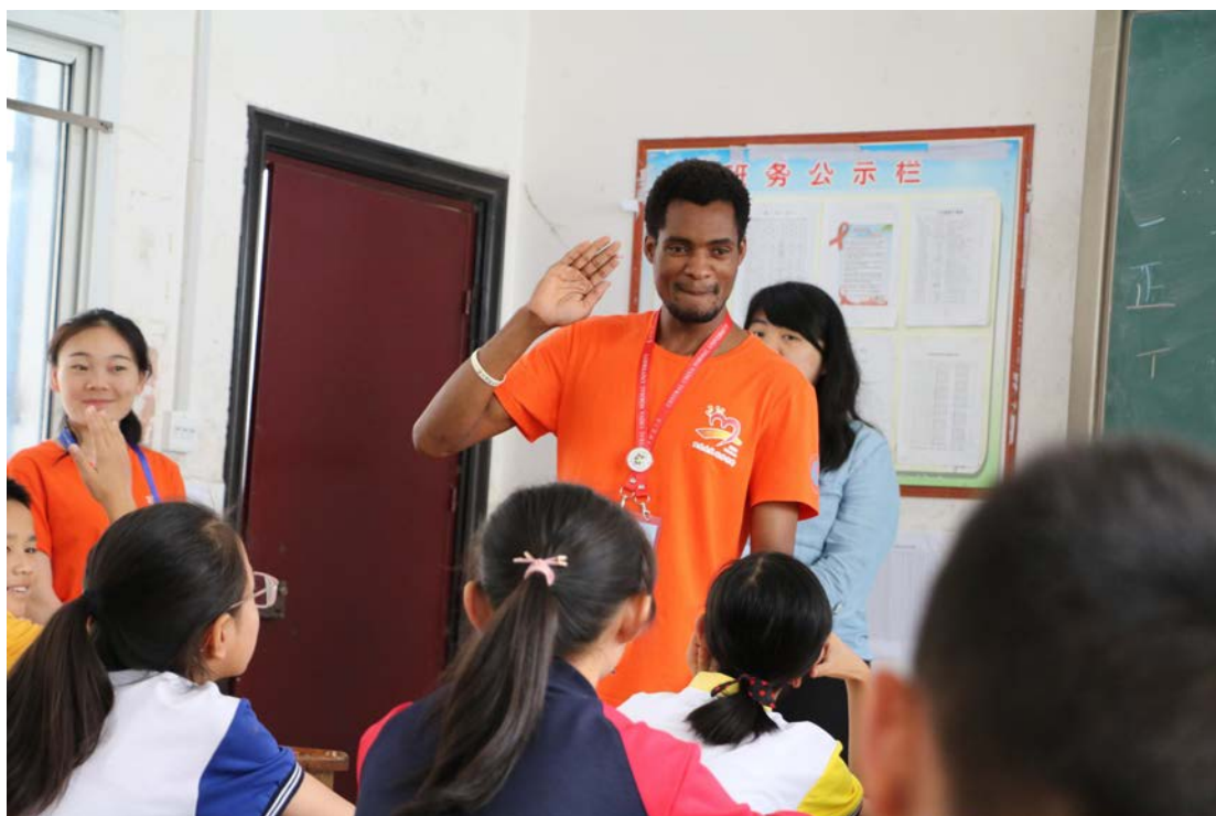
留學生阿布授課留學生阿布授課