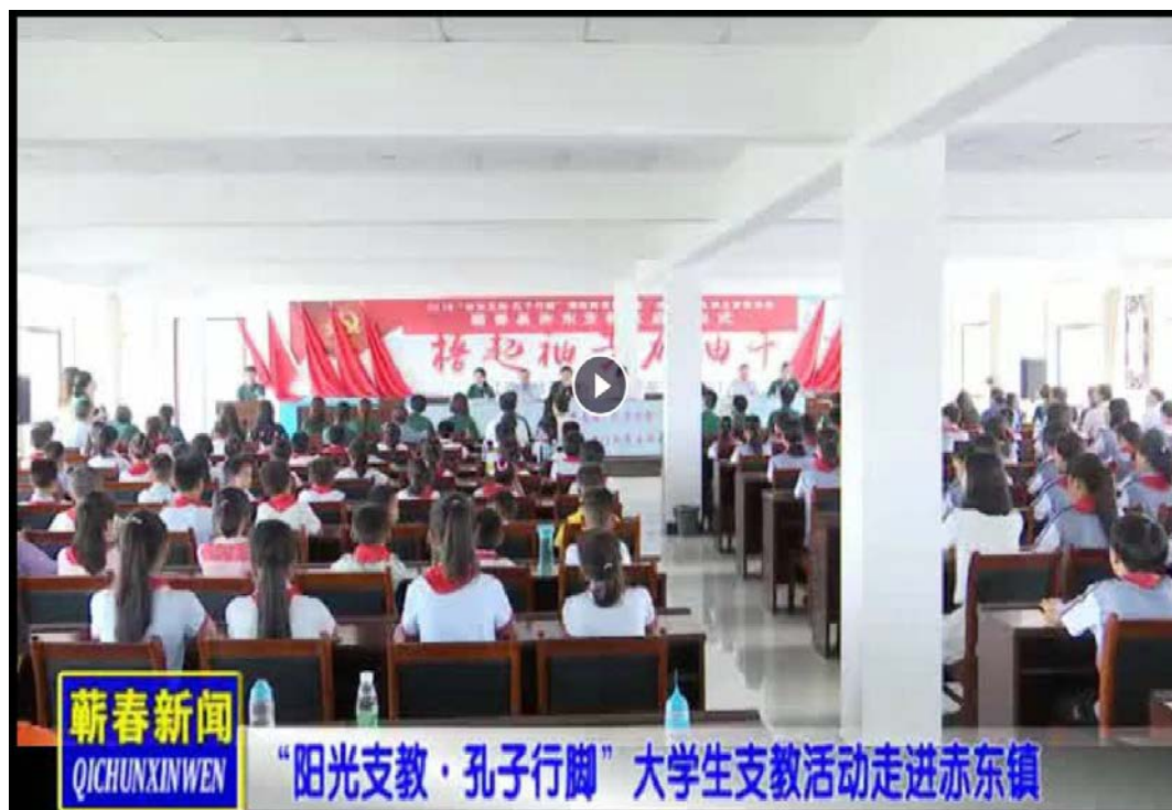
蕪春新聞視頻宣傳