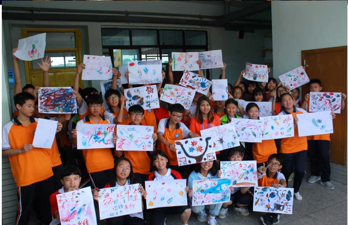
學生課堂成果展示