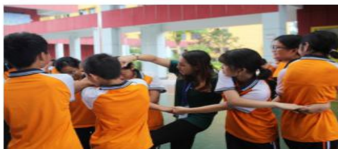
宣恩縣教育局宣傳

支教活动以开拓学生视野、促进学生快乐成长为宗旨，传播多元文化，实践最新教育理念。五天的支教活动中，支教队员们把知识与实践结合，为三个支教点的小朋友带来各地的习俗文化、语言文化、饮食文化，让孩子们充分感受到各地文化的多样性与趣味性。