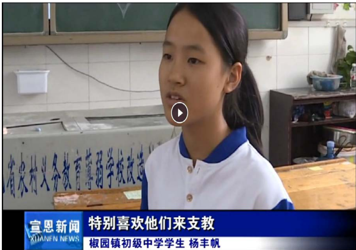
宣恩新聞視頻宣傳