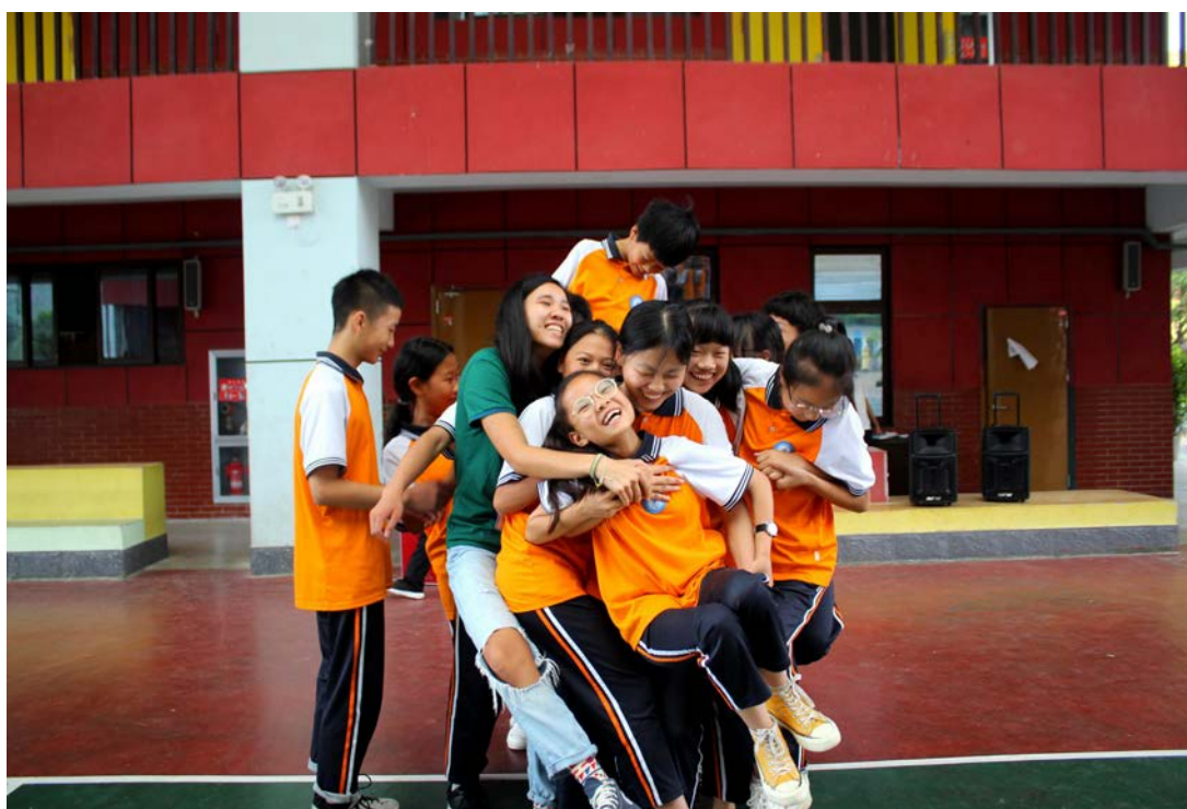
在支教地與當地學生們舉行團隊建設活動