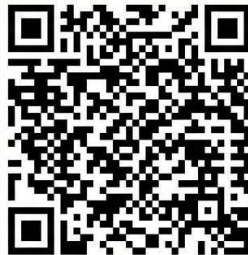
銀行代碼查詢 (Bank Code Search)