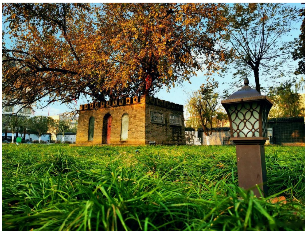
勝景二：新野漢桑城