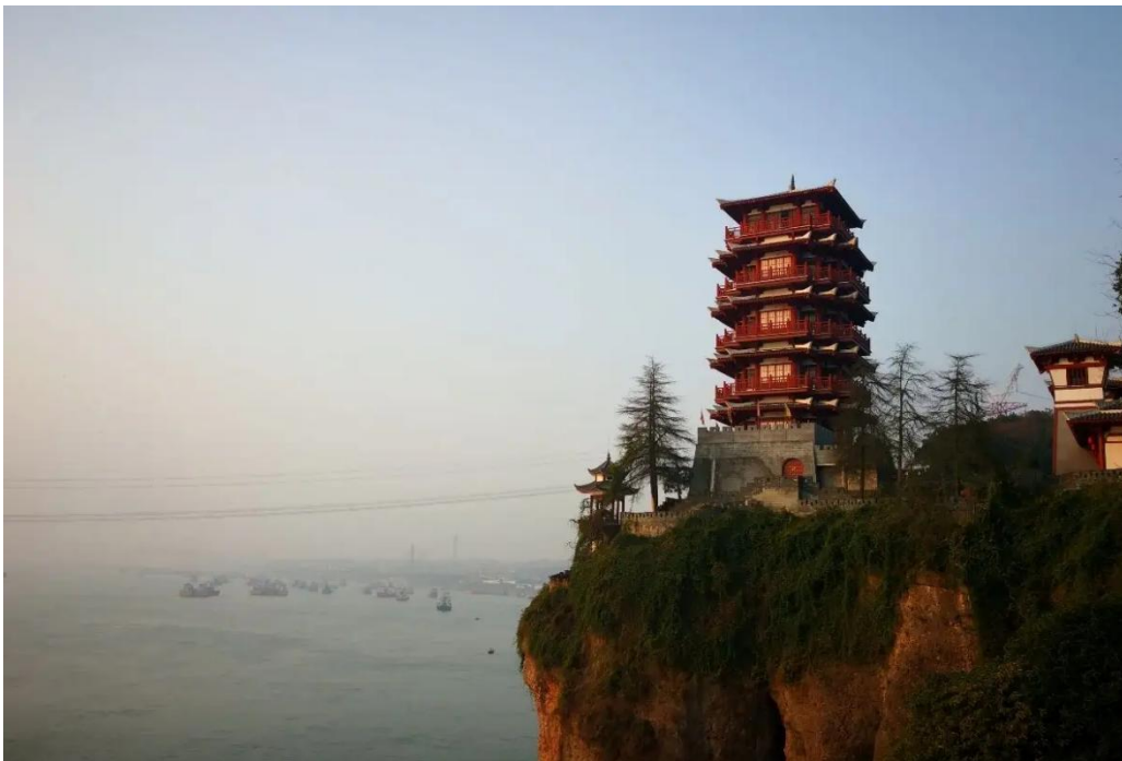
勝景八：宜昌猓亭古戰場