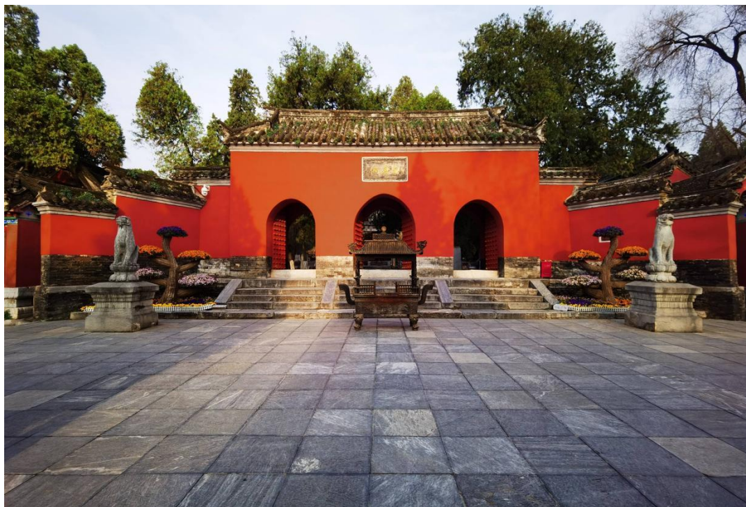
勝景一：南陽武侯祠