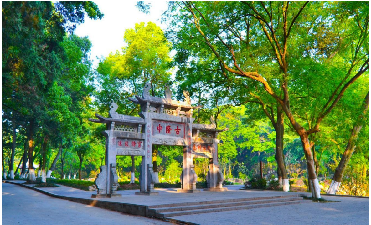
勝景三：襄陽“古隆中”