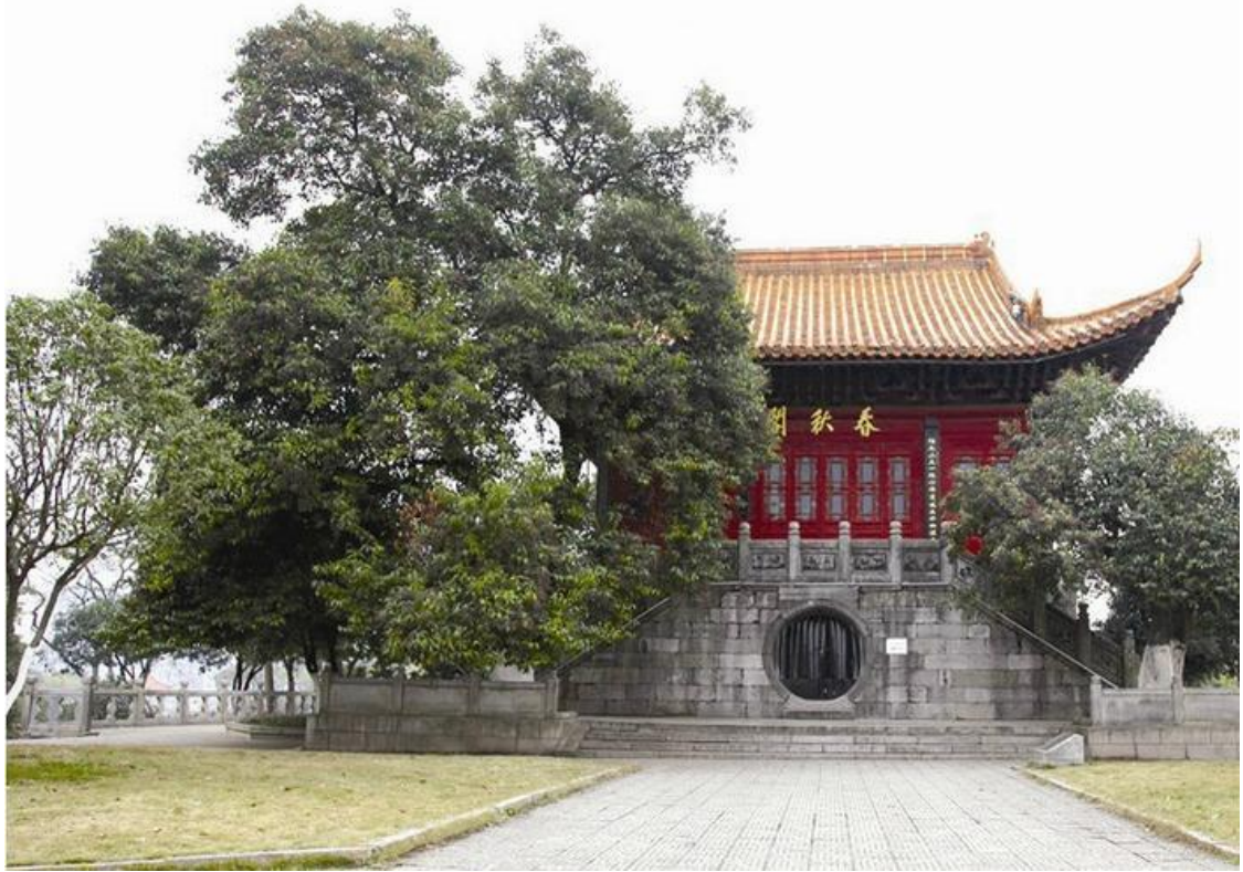
勝景五：荊州春秋閣