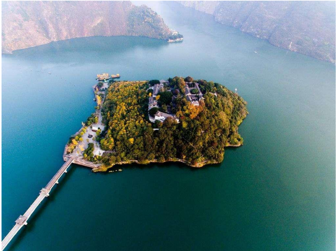
勝景九：奉節白帝城