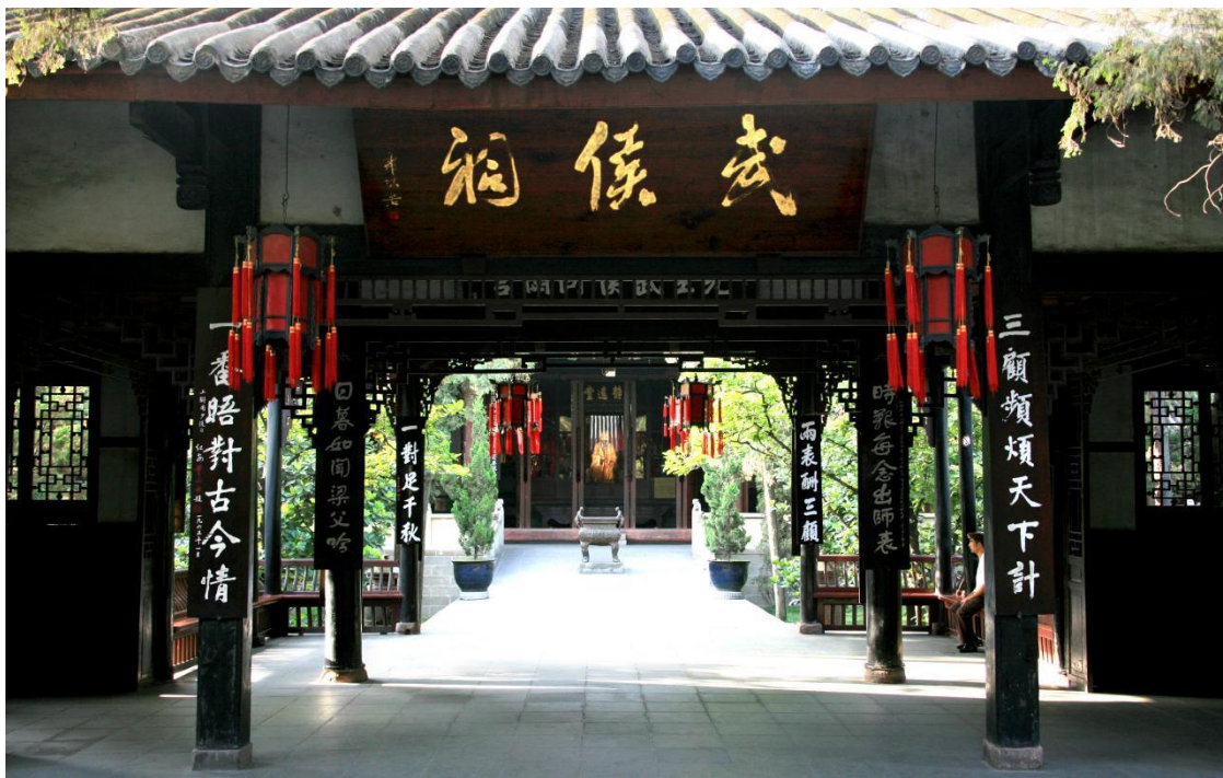
勝景十：成都武侯祠